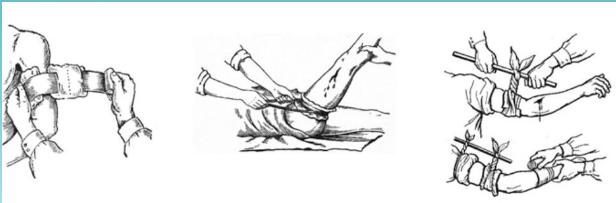
А) Давящая повязка