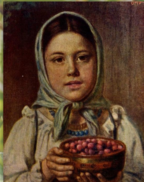
Н. Е. Рачков . Девочка с ягодами. 1879 г.