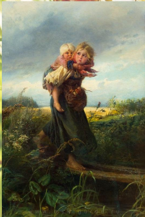
Маковский К.Е. «Дети, бегущие от грозы» 1872 г