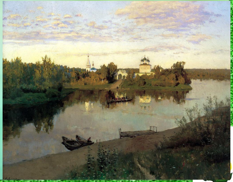
Исаак Левитан Вечерний звон 1892