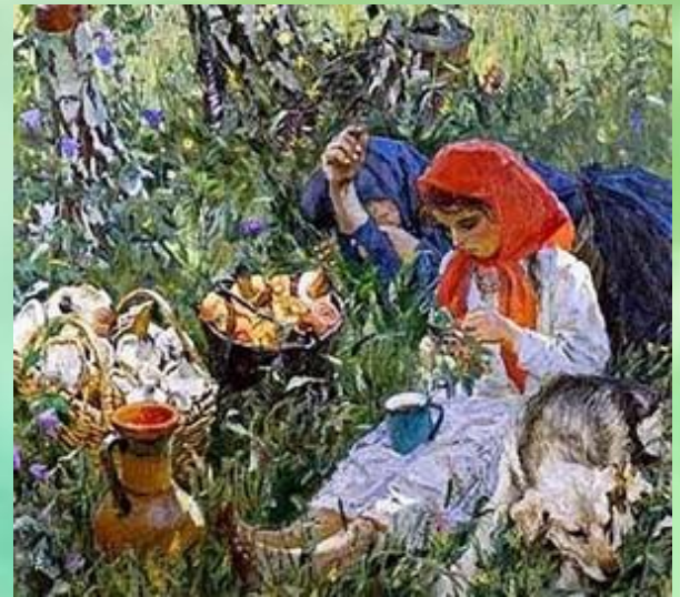
А. А. Пластов «Летом» 1954