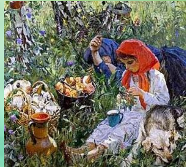
А. А. Пластов «Летом» 1954