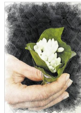
Материал подготовила: И.Стрельцова

Весна повстречалась с любовью! С главою большою, как наша! С неслеткой, но славною судьбою — судбу звали Слава и Даша. Весна этой паре дарила лучи и ручьи, все на счастье! В ручьях, где смеялся, бурлила, ахала их: и Маша, и Настя! Дарила весна много света и солнечных зайчиков ловких! Своею бежали дорогой они прямо к Светке от Левки! Весна всем любви добавляла при помощи ветра и тучек! Романтику их укрепила, чтоб было все ярче и лучше! Весною любовь осветила! Ее облака целовали! И птицам любовь повесела, чтоб звонче ее воспевали! Девочкам в глаза посмотрите! Любови они ждут, первоцветов!.. Побольше для них поберите слов нежных, как мимых прицветов! Подснежники, крокусы! Где вы? Весна принесла их с собою! Цветы и любовь — как напева! Слились — стали нашей судьбою!