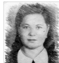
Нурсама в молодости

И наконец пришла наша Победа! Мы знали, верили в нее! Да разве может кто-то победить страну такую, Где даже дети встали грудью за нее!