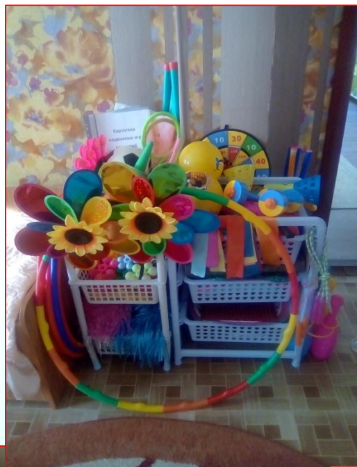
Физкультурны й уголок