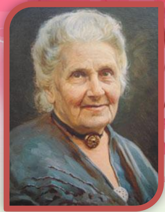
Мария Монтессори (1870-1952)

Дошкольное детство – период, когда формируются все базовые способности: внимание, логическое и творческое мышление, память и речь. И чтобы дети развивались всесторонне развитыми, необходимо время, чтобы развить эти способности. Наша базовая методика - это методика Марии Монтессори. И главная наша задача – это укрепление физического и психического здоровья, вырастить всесторонне развитую личность, самостоятельную и независимую.