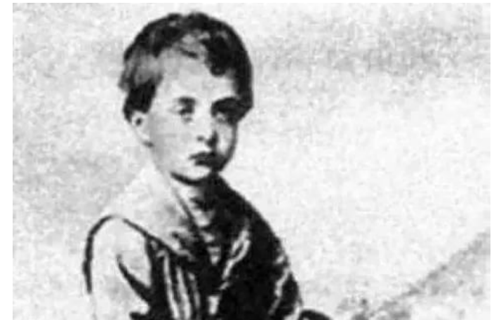
Тухачевский в детстве