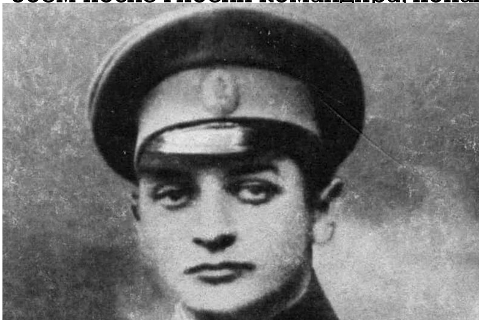
Л.Г подпоручик Тухачевский