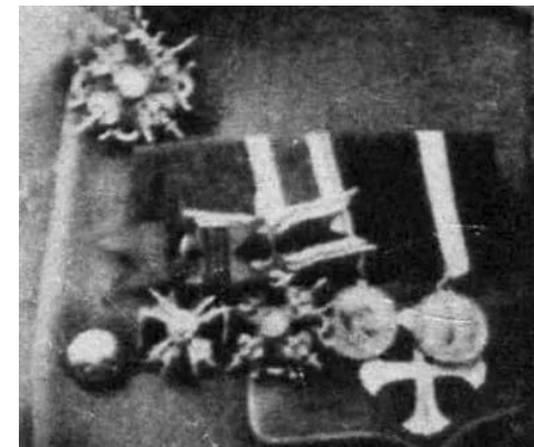
Награды Тухачевского в РИА