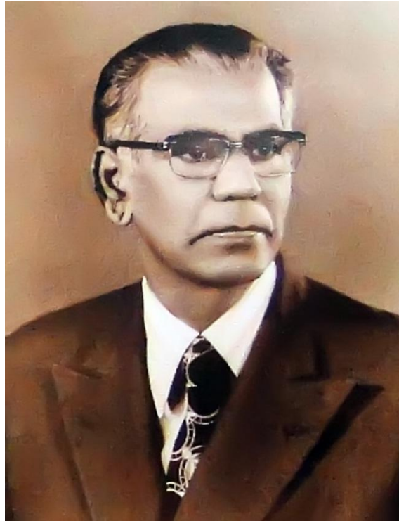
Борис Михайлович Теплов профессор педагогических наук

«Театр – это волшебный мир. Он дает уроки красоты, морали и нравственности. А чем они богаче, тем успешнее идет развитие детей...»