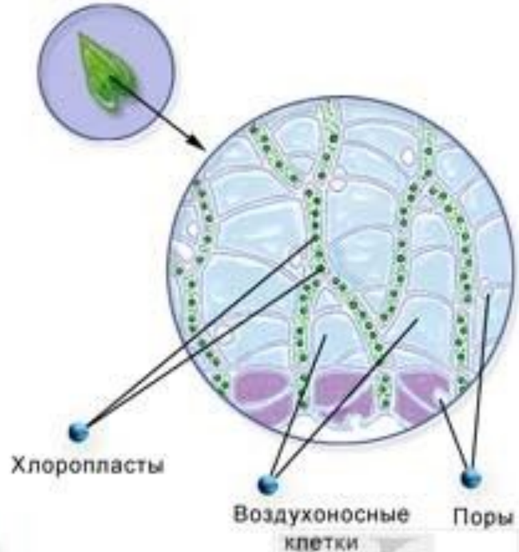
Клеточное строение листа сфагнума