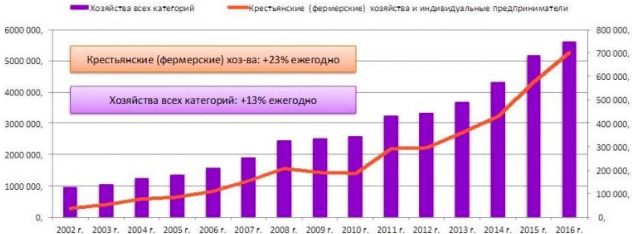
Продукция сельского хозяйства в действовавших ценах, млн. руб.