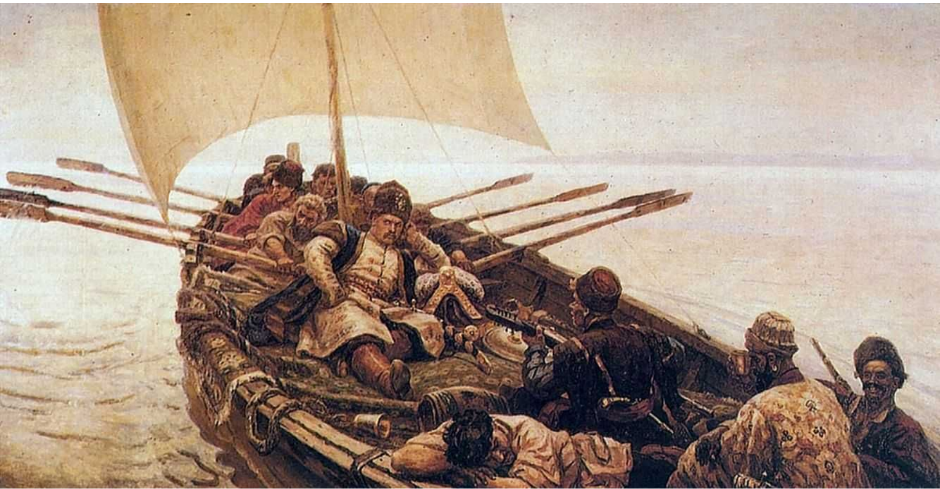
картина "Степан Разин", Суриков, 1906