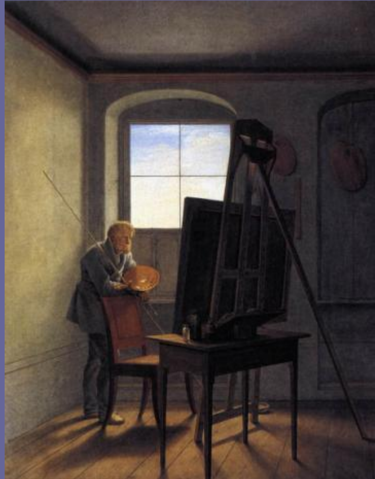
Георг Фридрих Керстинг. Каспар Давид Фридрих в своей мастерской. 1819