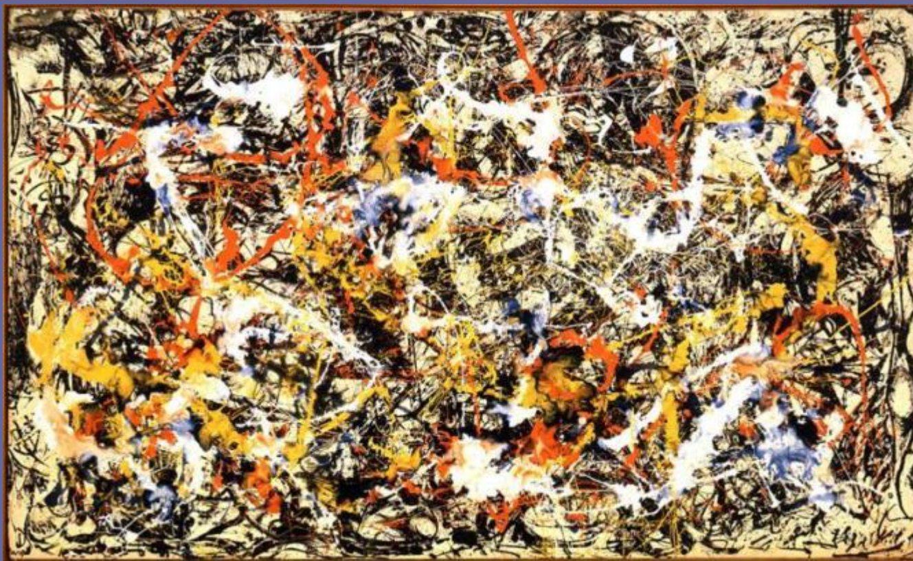
20. Джексон Поллок. Конвергенция. 1952