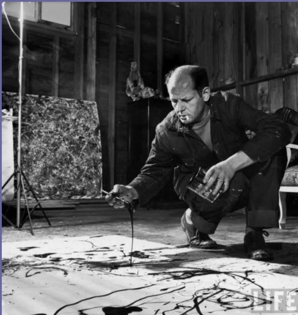
Джексон Поллок за работой. 1949