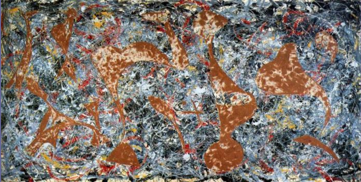
Джексон Поллок. Из паутины. 1949