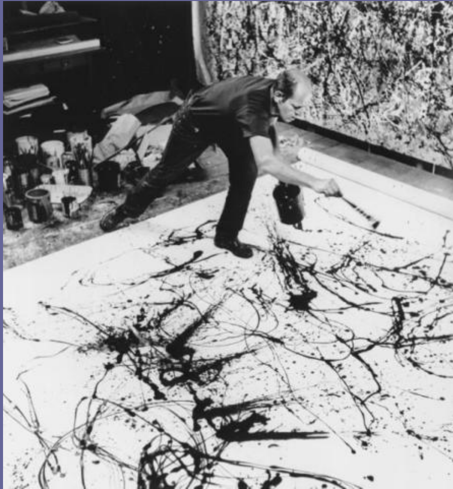
Джексон Поллок за работой.