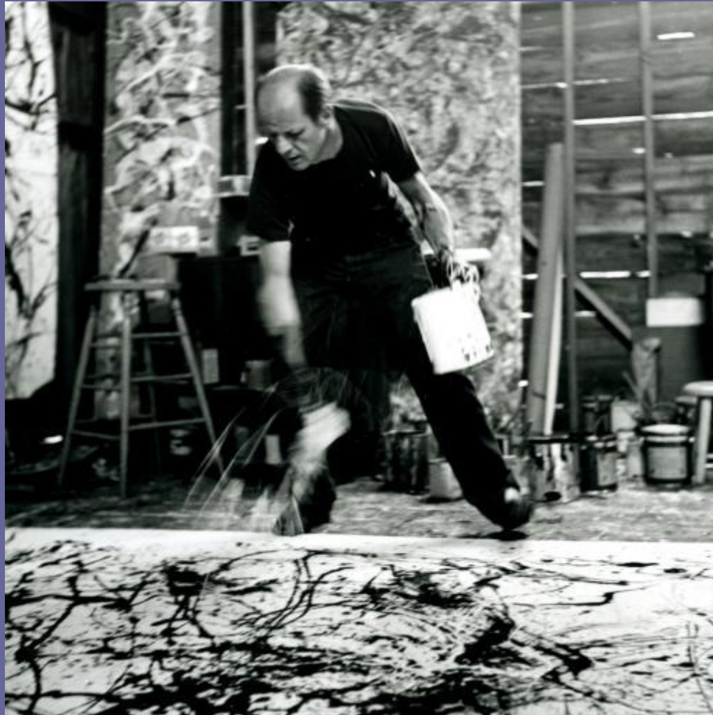
Джексон Поллок за работой. 1950