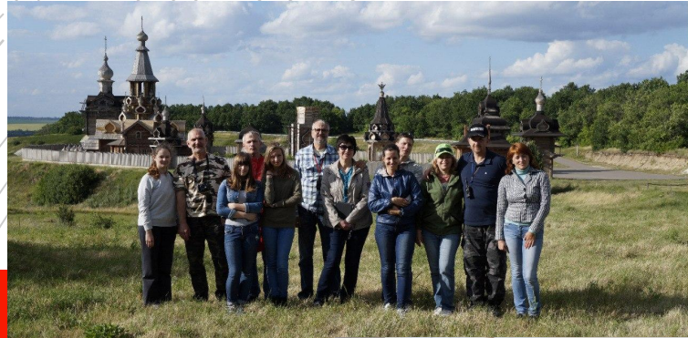
Белогорье 12-15 июля 2014