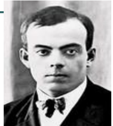
Антуан де Сент- Экзюпери (1900 - 1944)