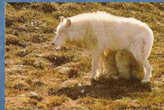
полярный Shared ВОЛК