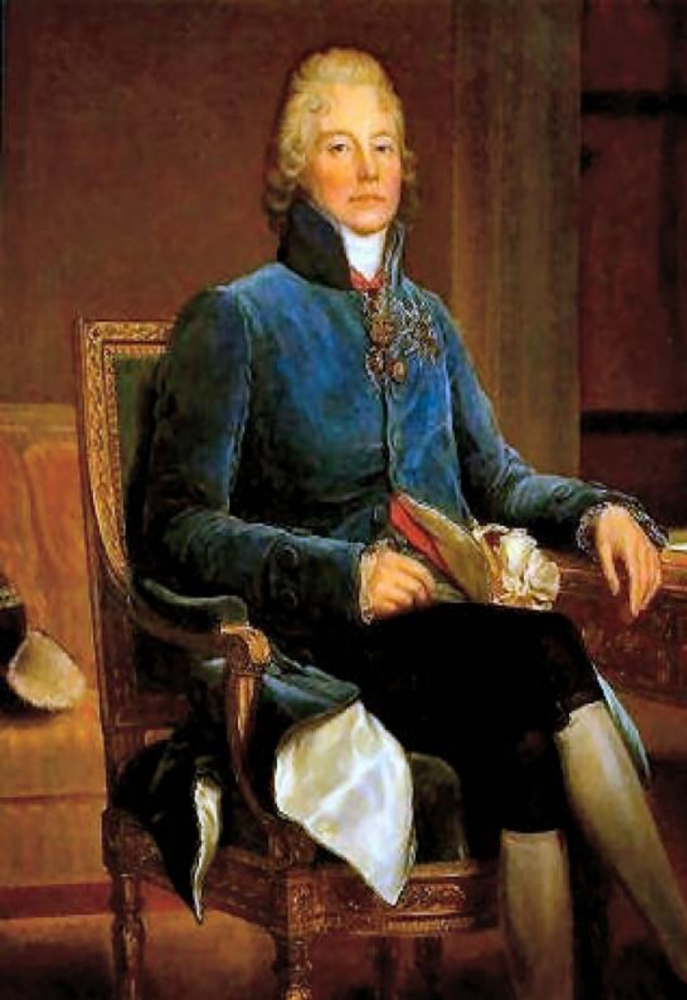
Талейран- Перигор, князь Беневентский