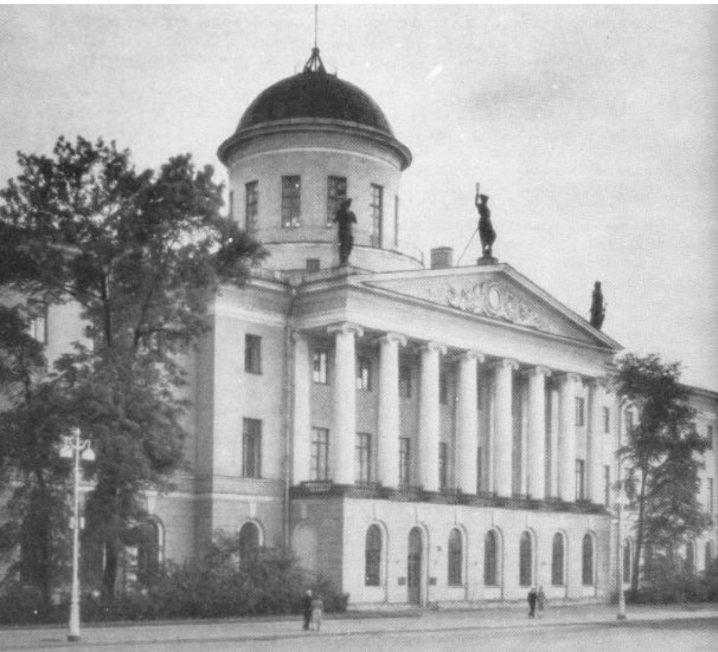
Пушкинский дом в Санкт-Петербурге