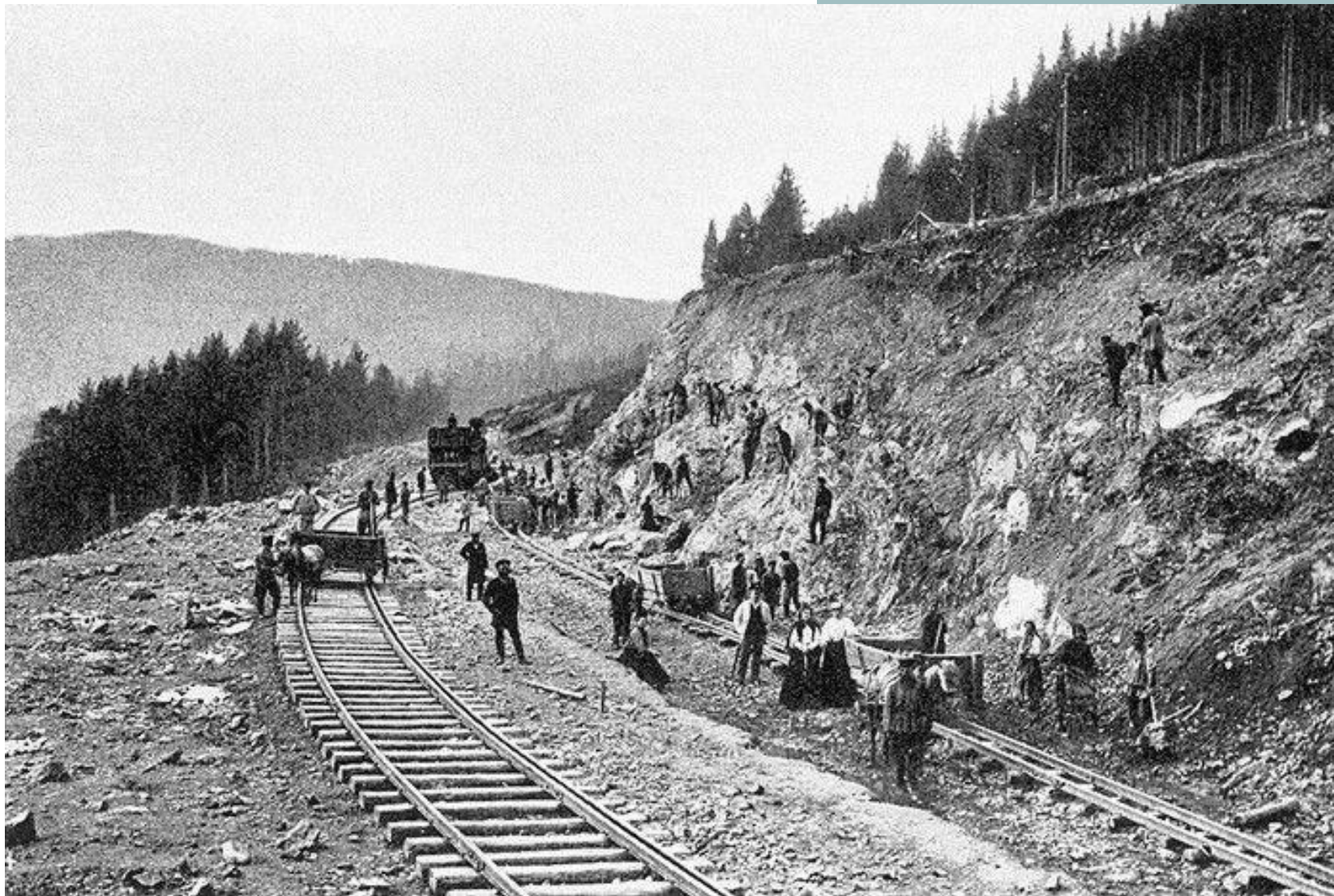
Строительство железной дороги в Российской империи 20 век