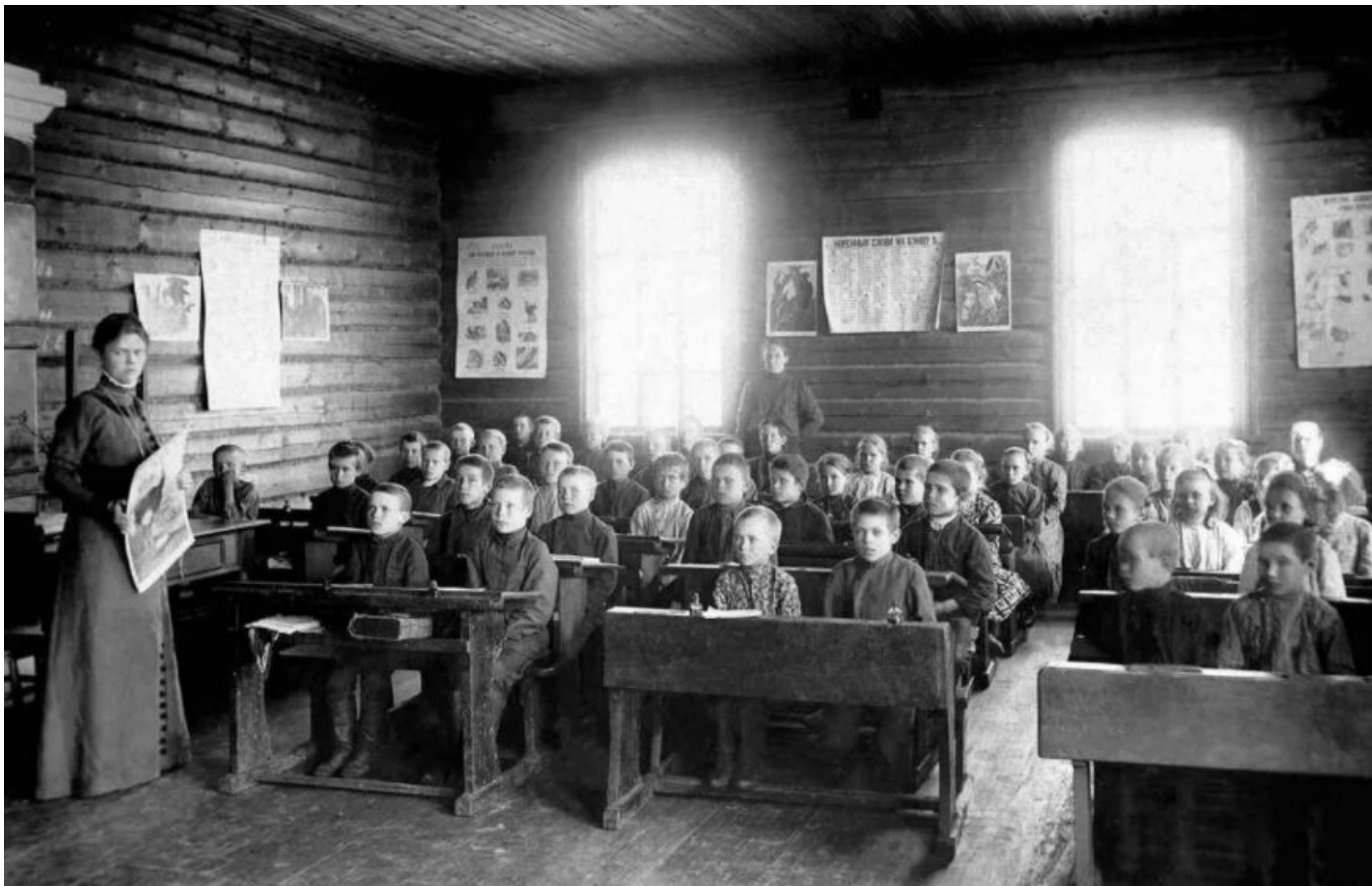
Школа начала 20 века