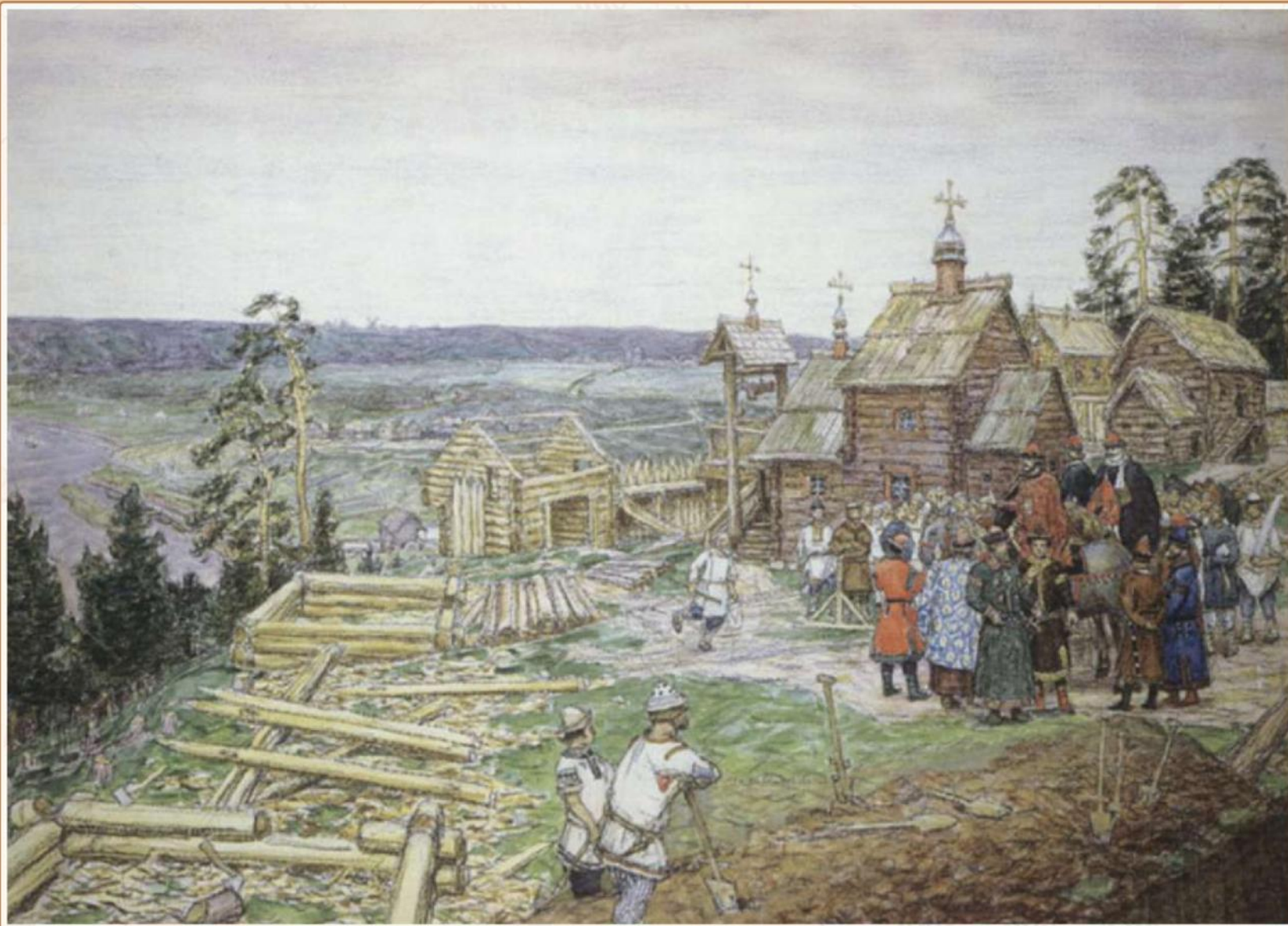
Основание Кремля. Постройка новых стен Кремля Юрием Долгоруким в 1156 г. Фрагмент. Художник А. М. Васнецов