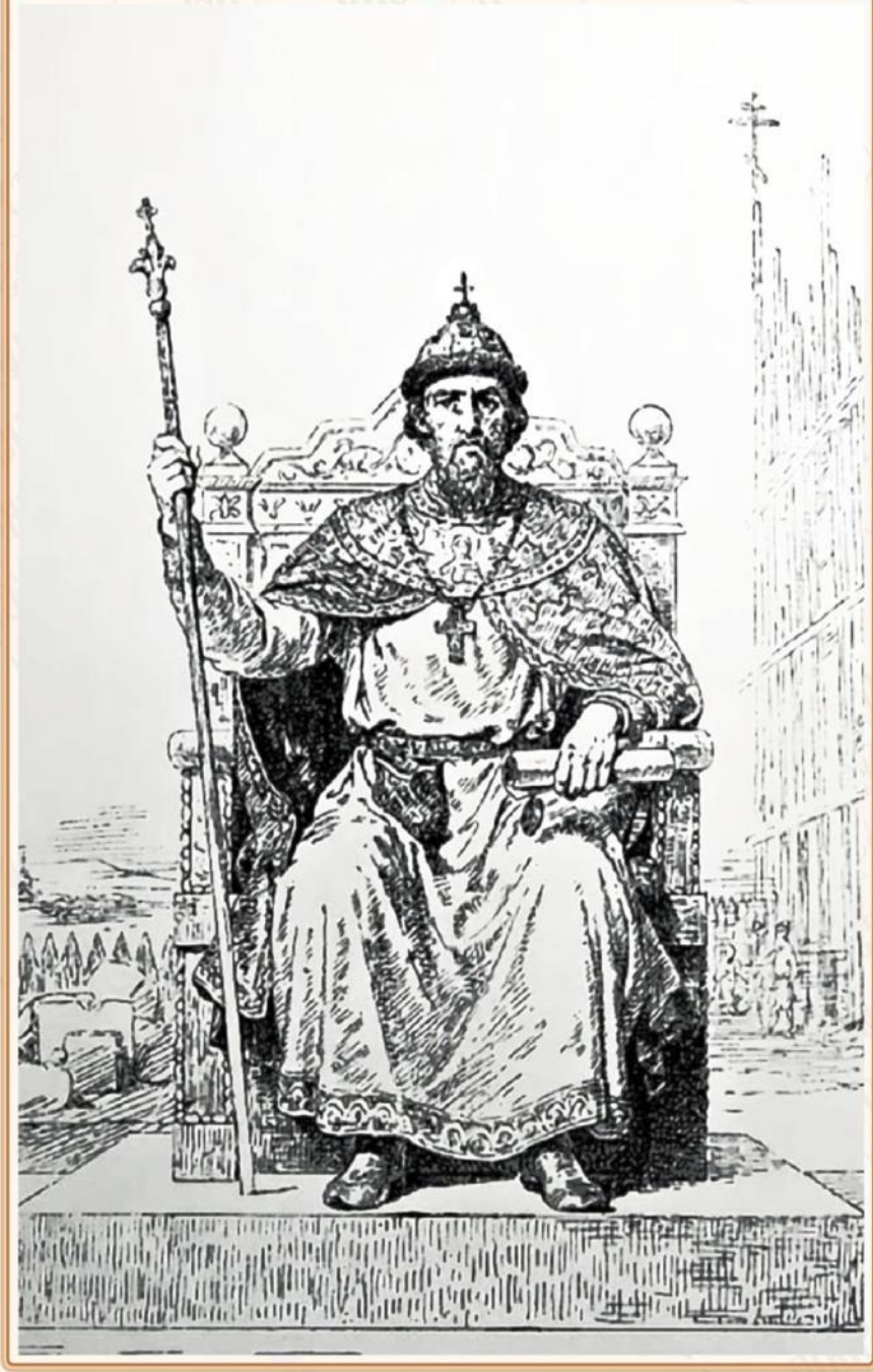
Иван Данилович Калита