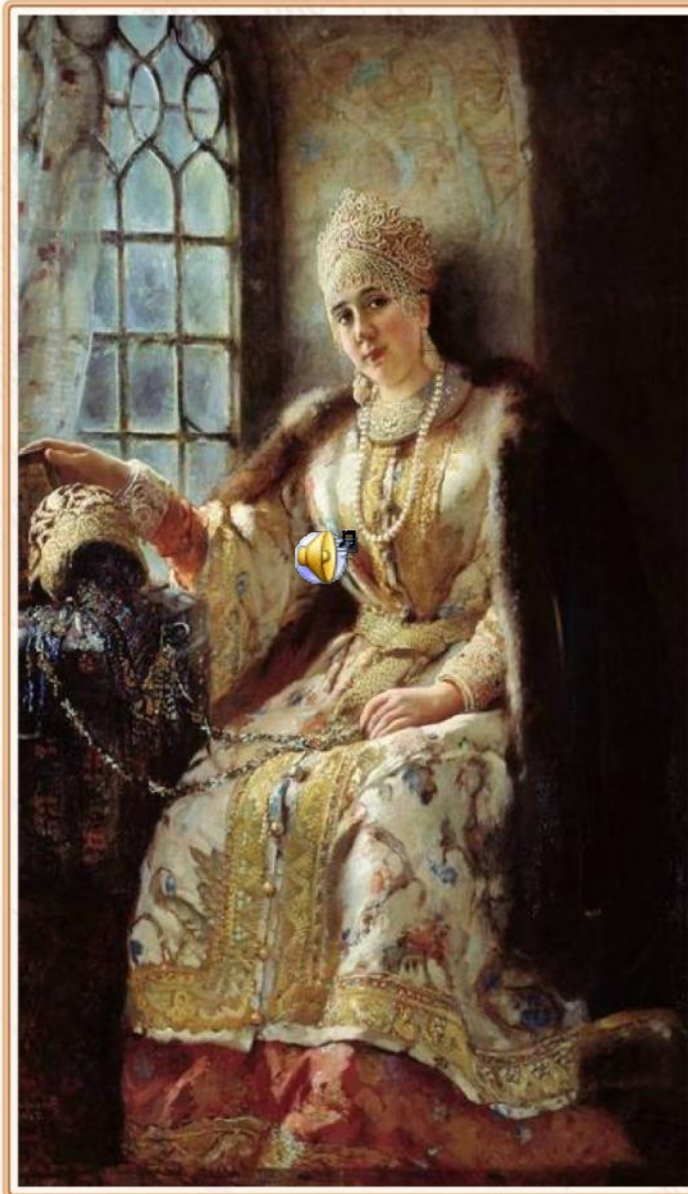
Боярыня. Художник К. Е. Маковский