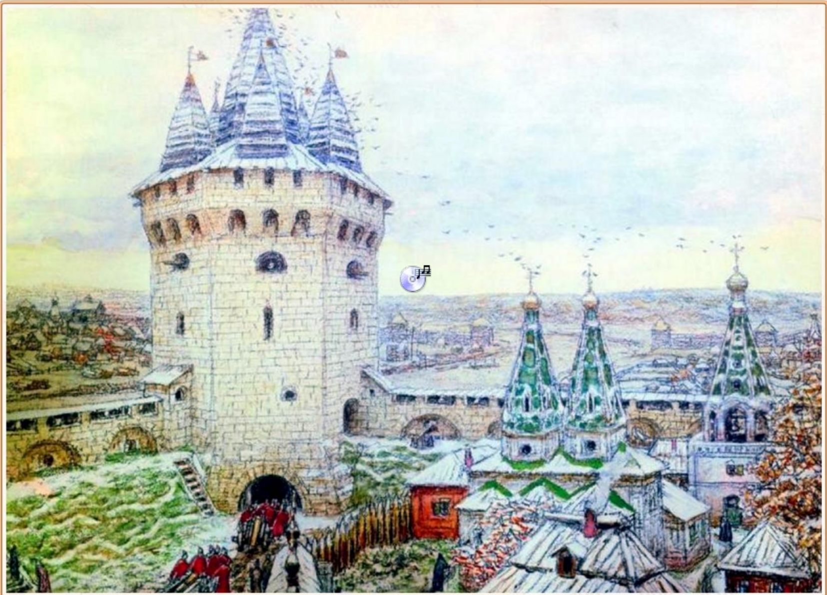
Семиверховая угловая башня Белого города. Художник А. М. Васнецов