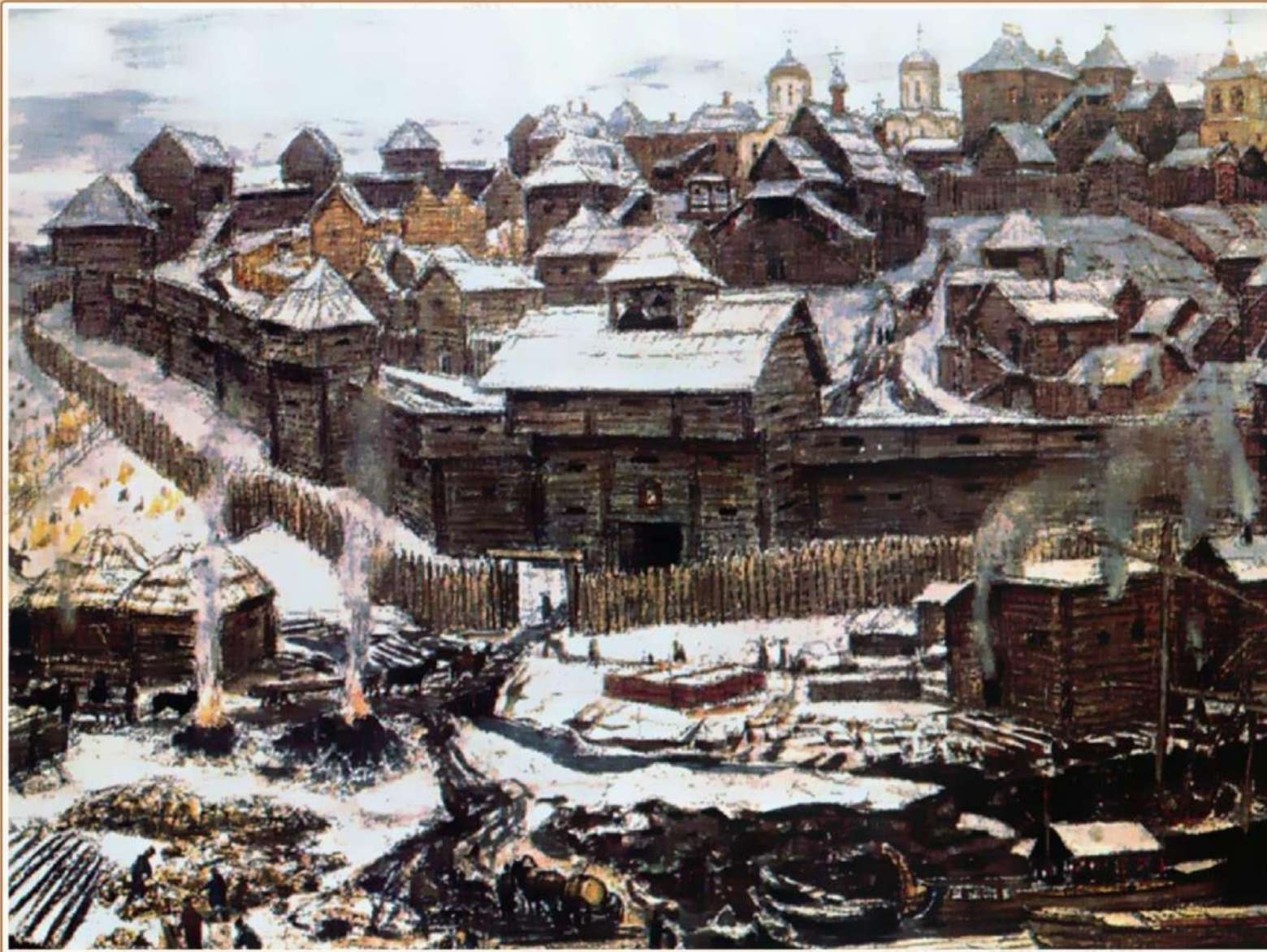
Московский Кремль при Иване Калите. Художник А. М. Васнецов