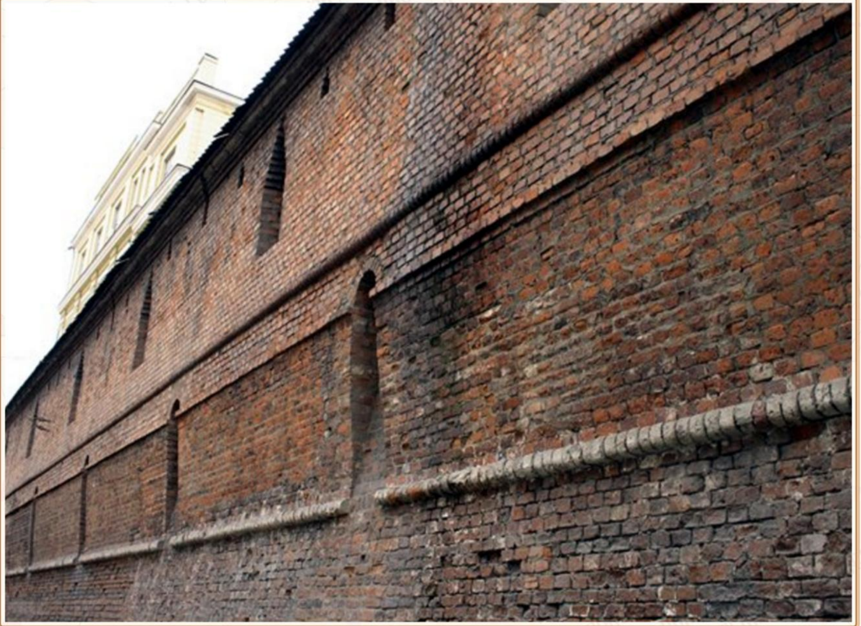
Фрагмент Китай-городской стены