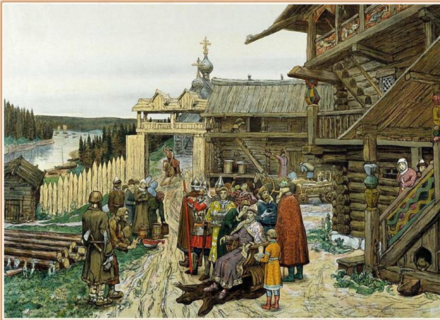
Двор удельного князя. Художник В. М. Васнецов