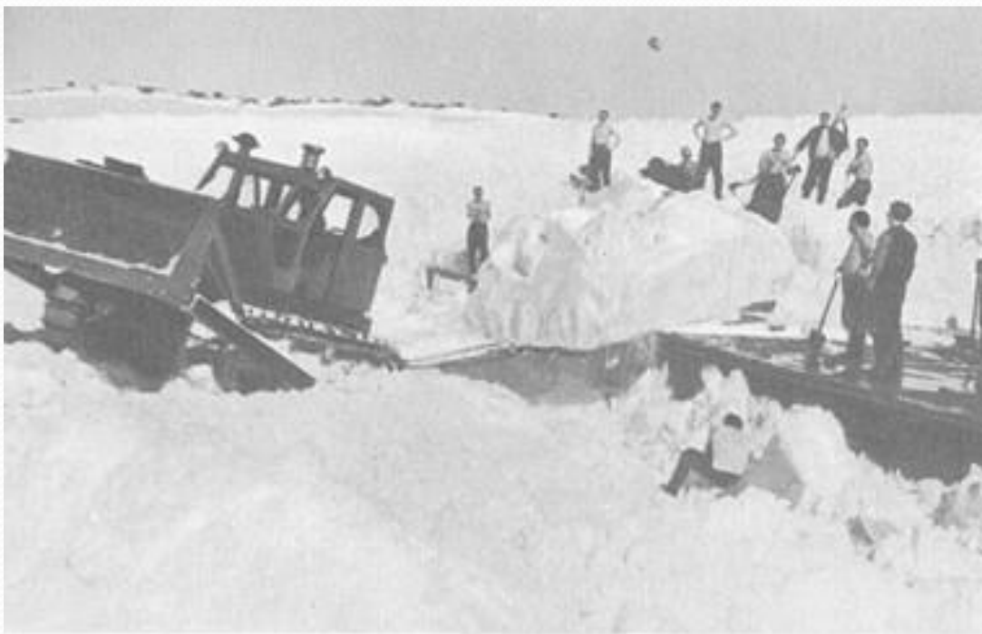
Вскоре после строительства обсерватории Мирный многие дома оказались погребены под снегом. Так приходилось убирать снег с крыш домов... Сейчас поларники переселились в новые двухэтажные дома.