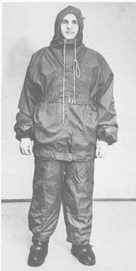
Одна из последних моделей утепленных костюмов советских поларников.

В 1957 году была построена первая советская антарктическая станция «Мирный». Через несколько лет здания оказались под 7- 10 метровым слоем снега.