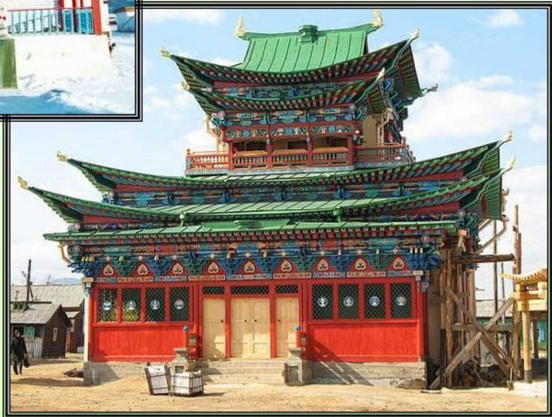
Иволгинский дацан – буддийский монастырь-университет