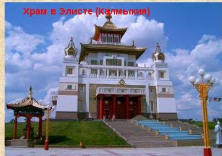
Храм в Элисте (Калмыкия)