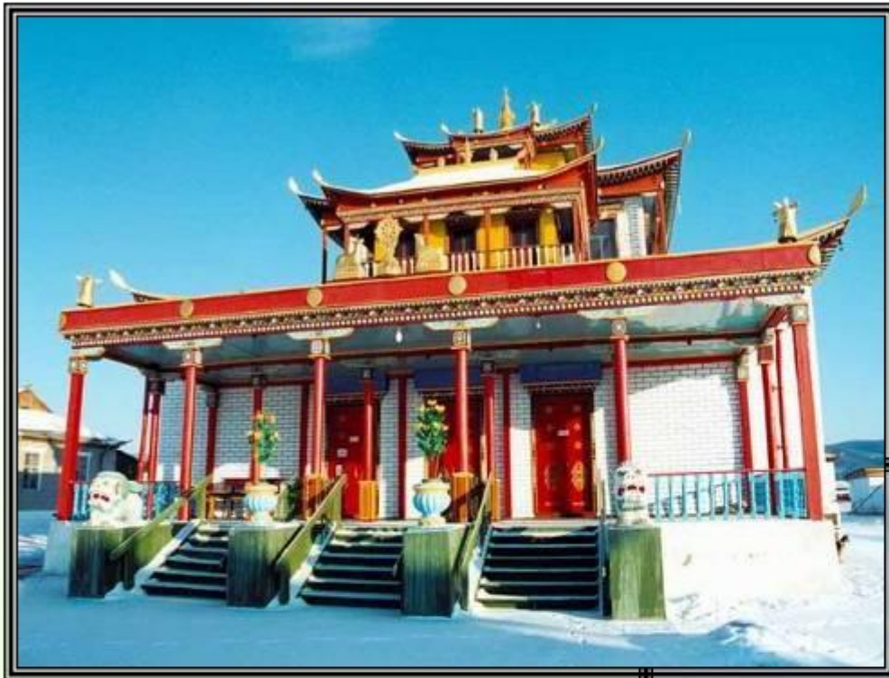
Буддийский храм в Бурятии