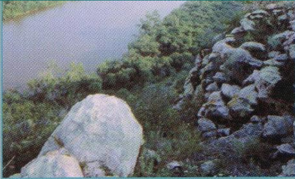
Долина реки Джиды