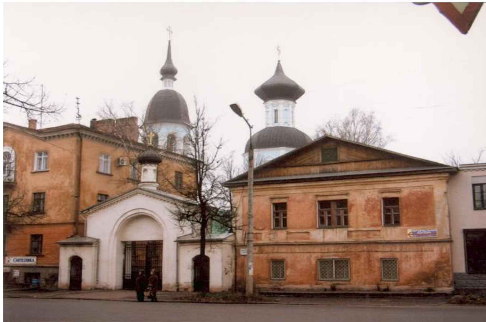
Улица К. Либнехта. Рядом улица Пионерская.