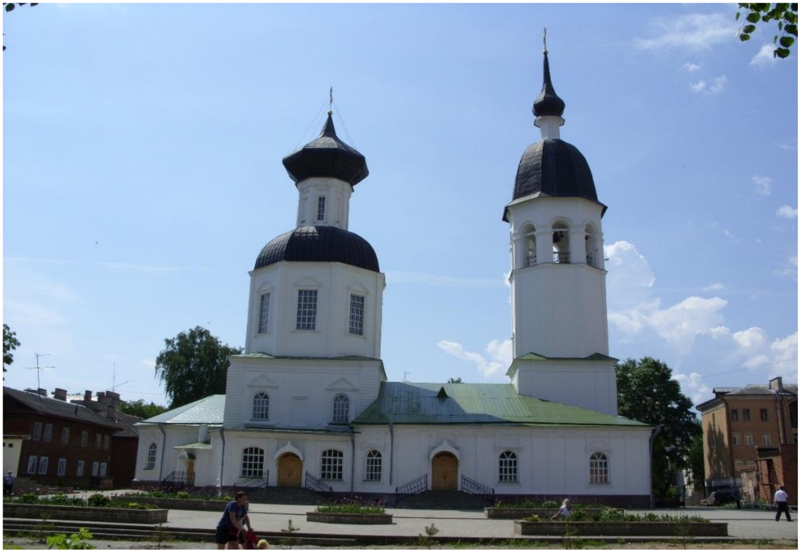
Свято – Вознесенский собор.