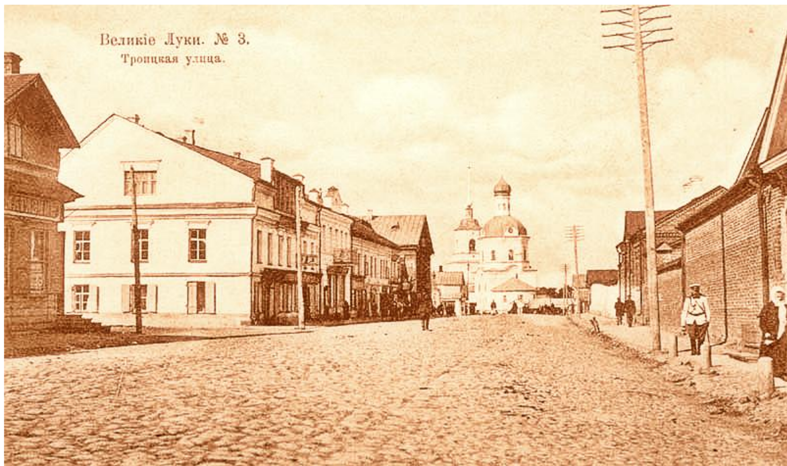
Улица Троицкая . На её углу – дом купца Шульгина, на мансарде которого располагалось лучшее великолукское фотоателье М. Мельникова. На заднем плане – Троицкая церковь. Справа – стена Вознесенского монастыря. Снято от Ильинской улицы .