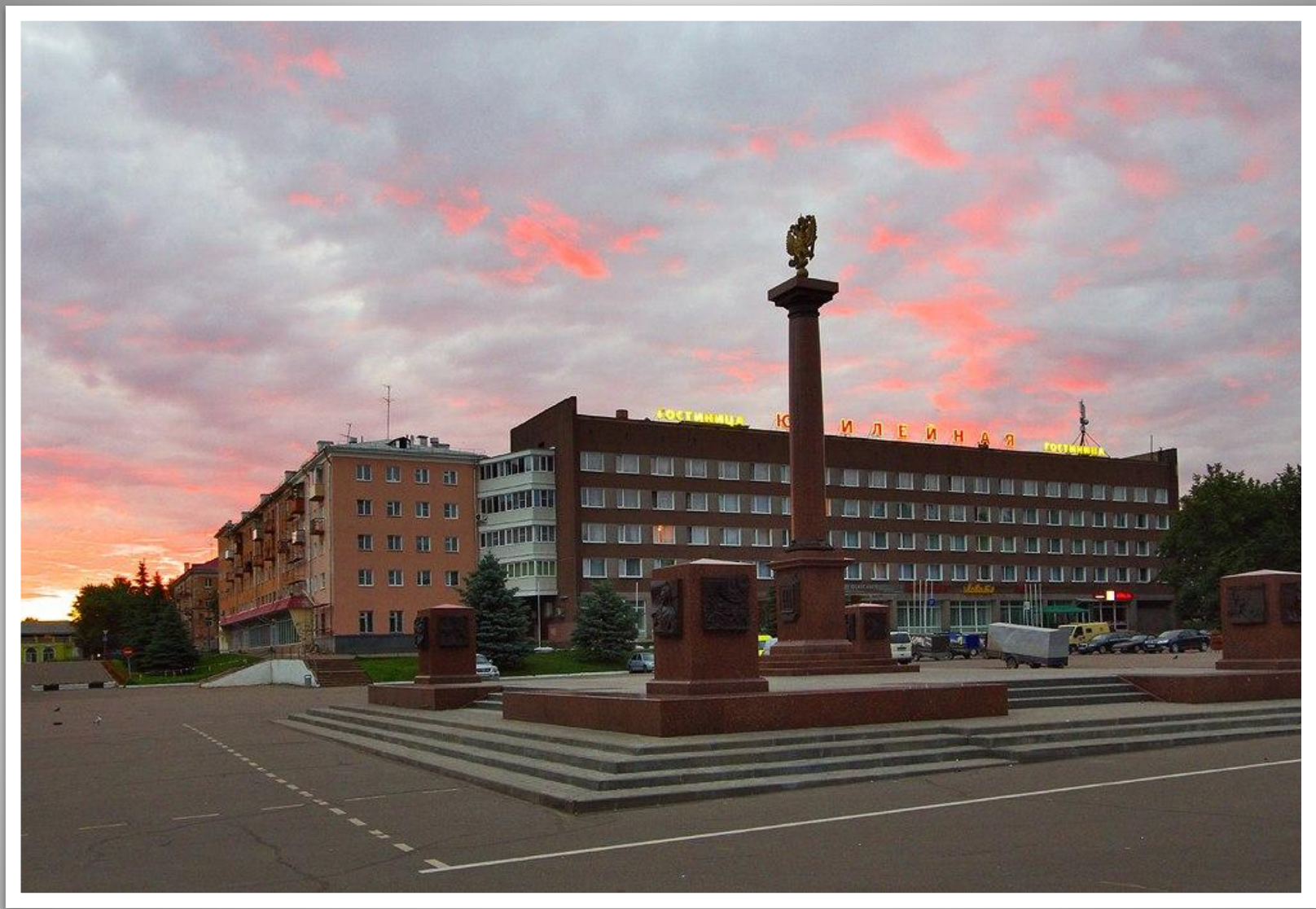
Площадь им. В. И. Ленина