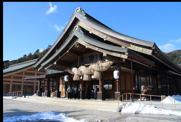
Синтоистское святилище Идзумо-тайся

Синтоистская архитектура — важная составляющая японской архитектуры. Она, как и религия синто, уникальна для Японии. Испытывая влияние буддистской архитектуры, она, тем не менее, сохранила особенности японских зданий доисторического периода.