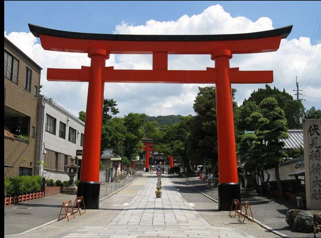
Тории в святилище Фусими-Инари, Киото

Обычно они стоят на пути к святилищу и отмечают начало священной территории