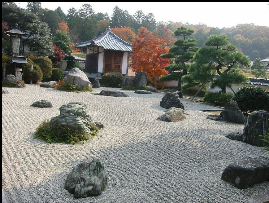
Сад камней в Като, Хиого

Сад камней (яп. 枯山水 карэсансуй, букв. «сухие горы и воды»), также «сэкидэй» (яп. 石庭, букв. «каменный сад») — культурно-эстетическое сооружение Японии, разновидность японского сада, появившаяся в период Муромати (1336—1573).