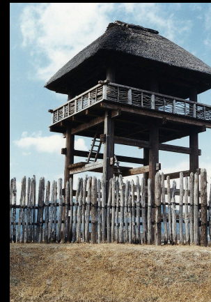
Реконструкция наблюдательной вышки на стоянке Ёсиногари, недалеко от города Тоса