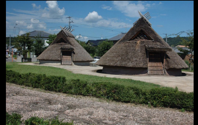
Реконструкция жилищ, город Сэтоути