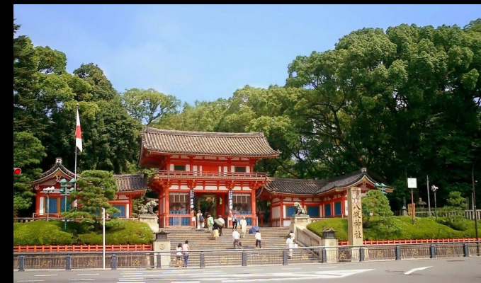
Синтоистский храм Дзиндзя