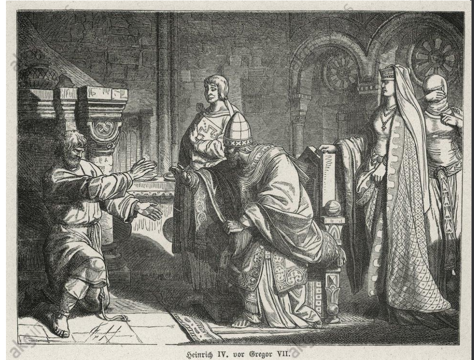
Heinrich IV. vor Gregor VII.