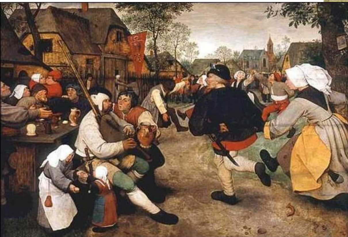
Танцующие крестьяне. 1568-1569. (Питер Брейгель Старший)