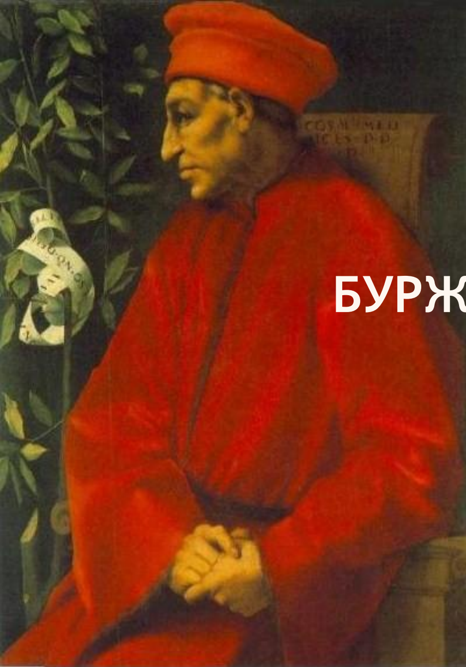
Банкир Козимо Медичи. (Джакомо Понтормо)