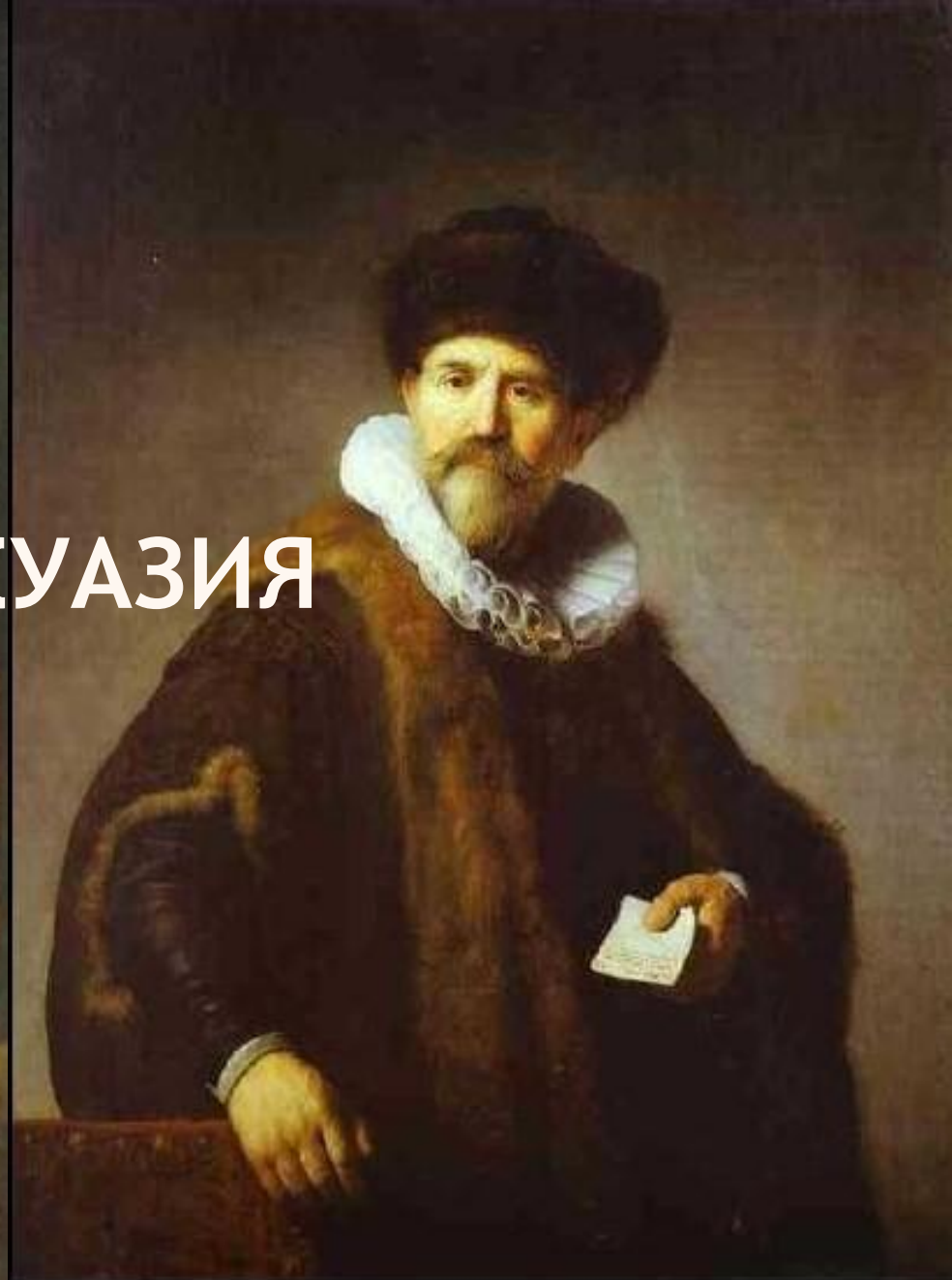
Амстердамский купец. (Рембрандт)