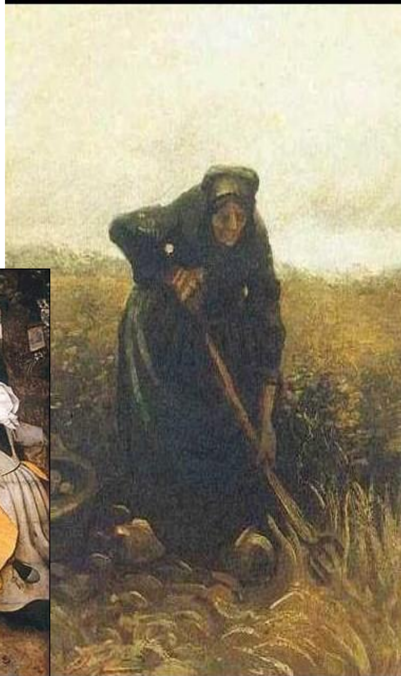
Крестьянка, копающая картошку