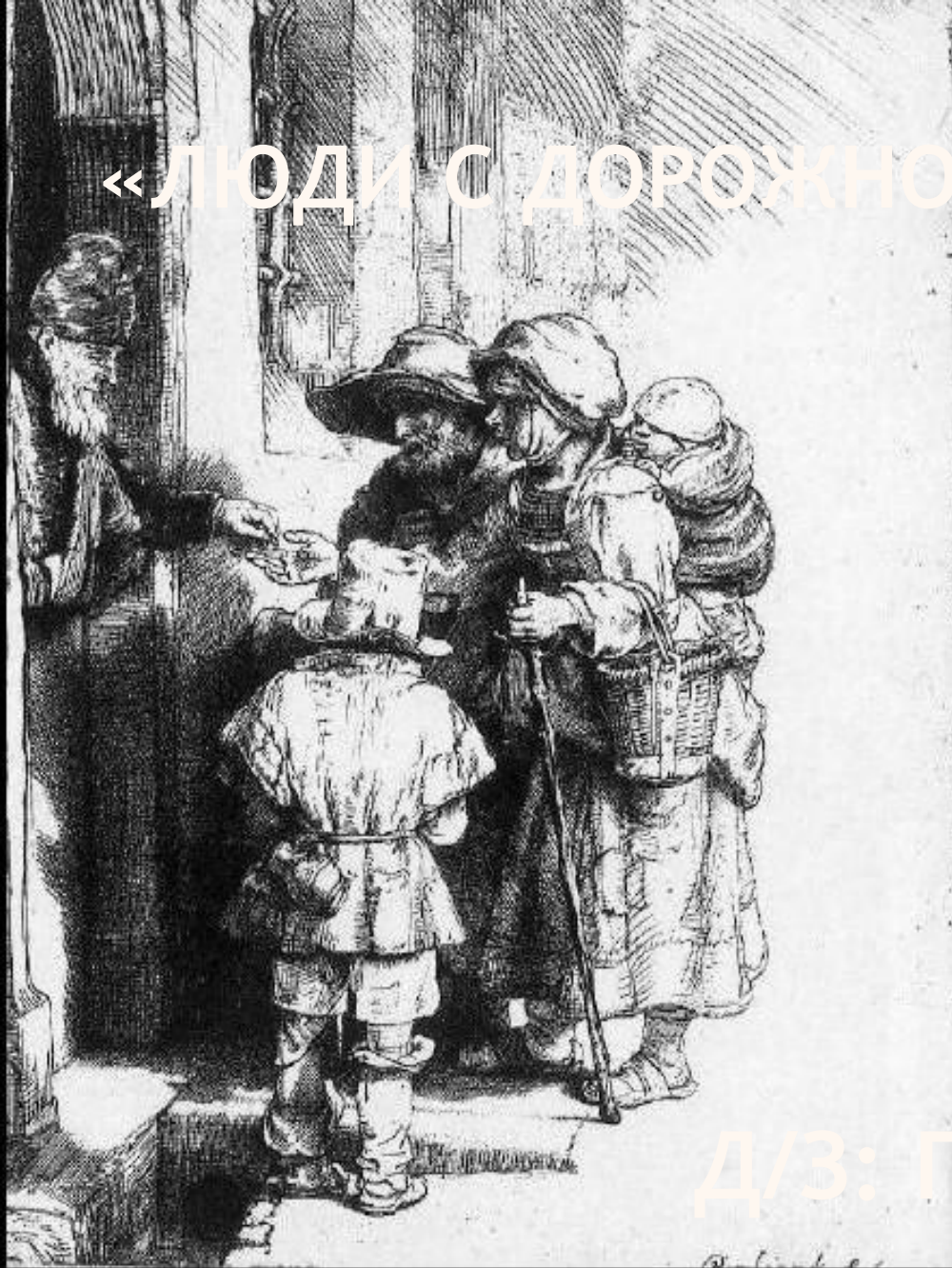
Нищие, получающие милостыню у двери дома. (Рембрандт)