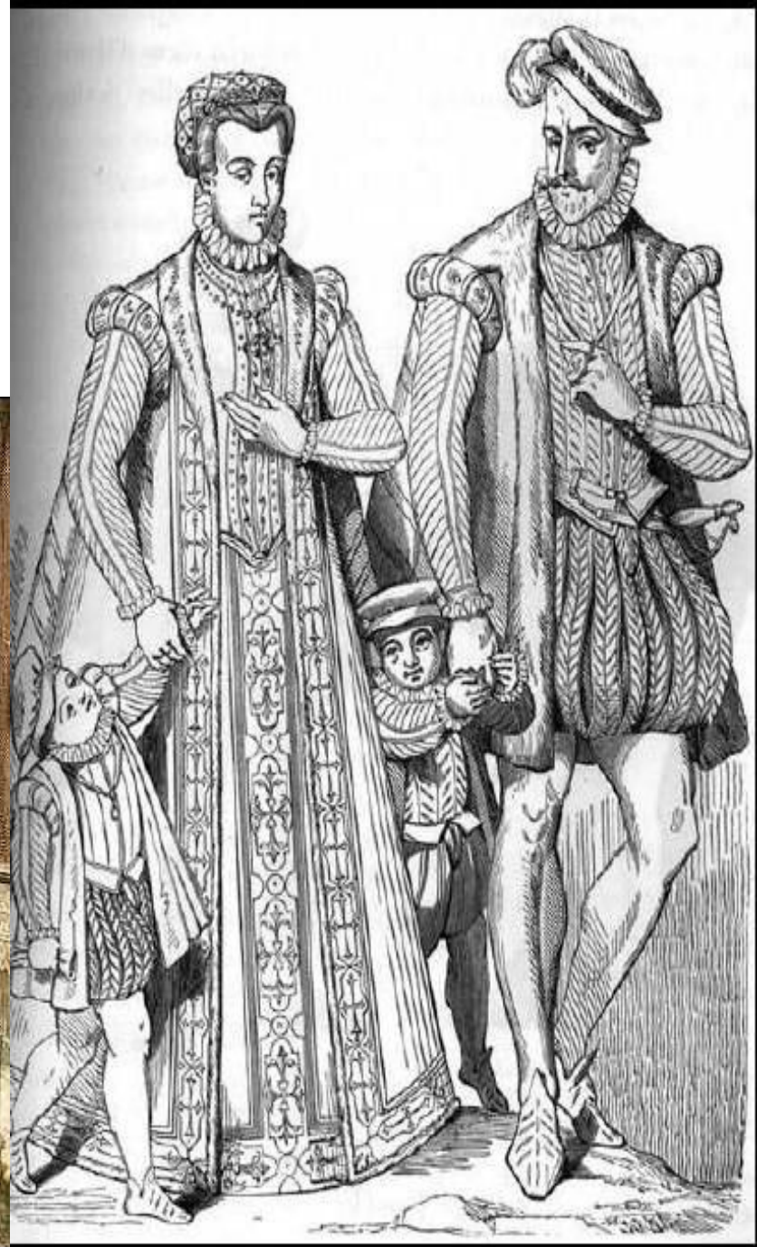
Семья джентри, в костюмах по моде 1565 г.