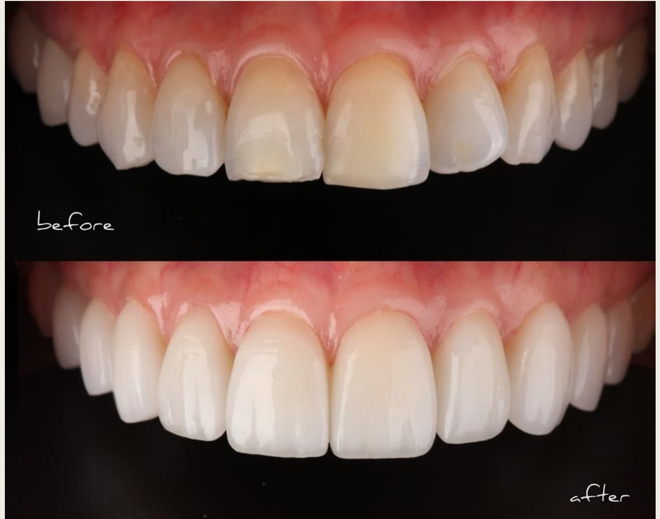
До и после установки виниров

1982 году. Современные виниры представляют собой тончайшие пластинки, обладающие множеством положительных свойств: они долговечны, прочны и при должном уходе служат от 10 до 15 лет.