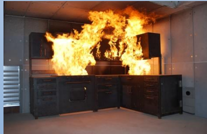
Пожар в квартире