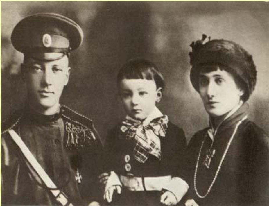
А.Ахматова, Н.Гумилев с сыном. 1916 год