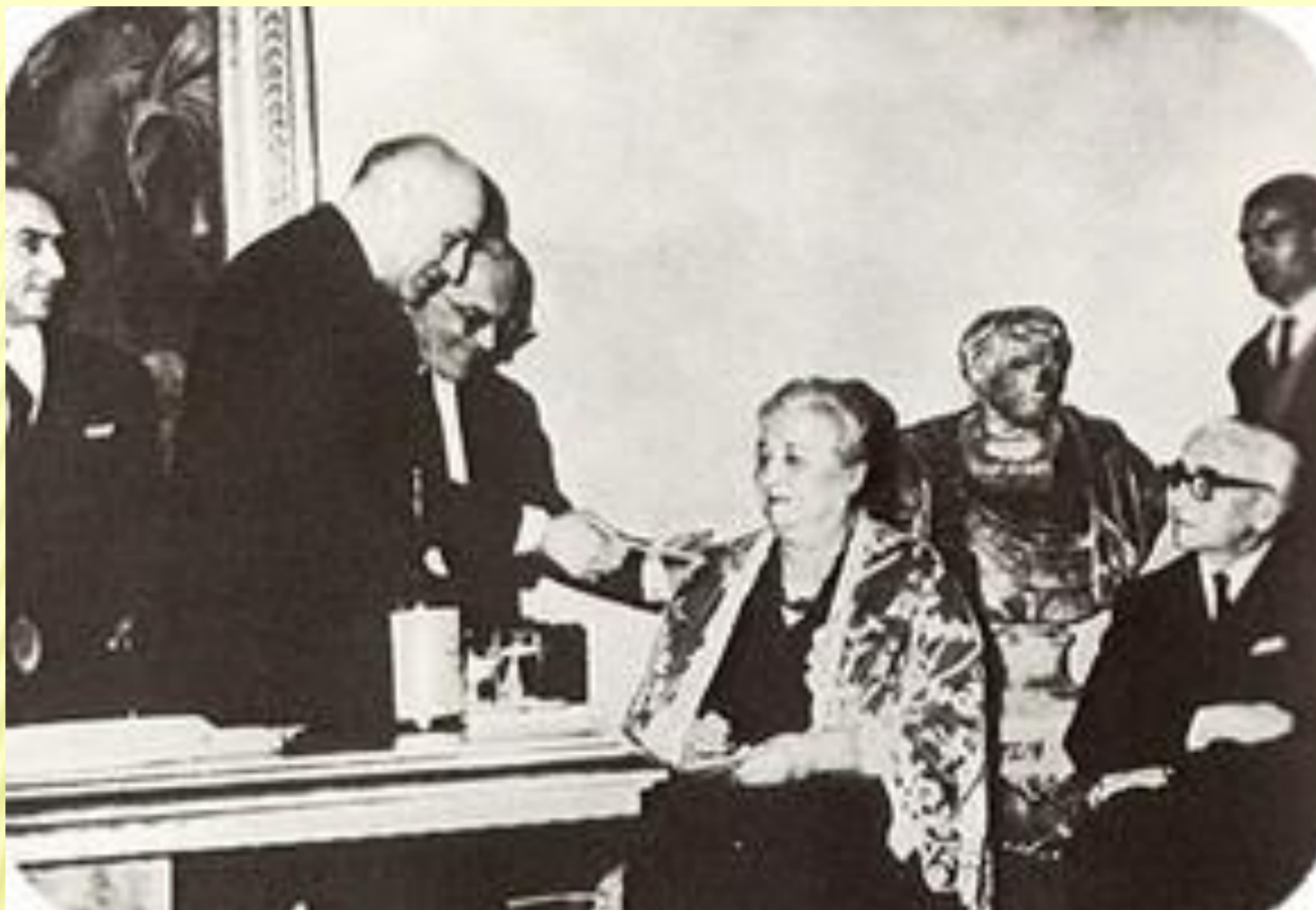
Вручение Анне Ахматовой международной премии «Этна Таормина». Италия. 1964 год.