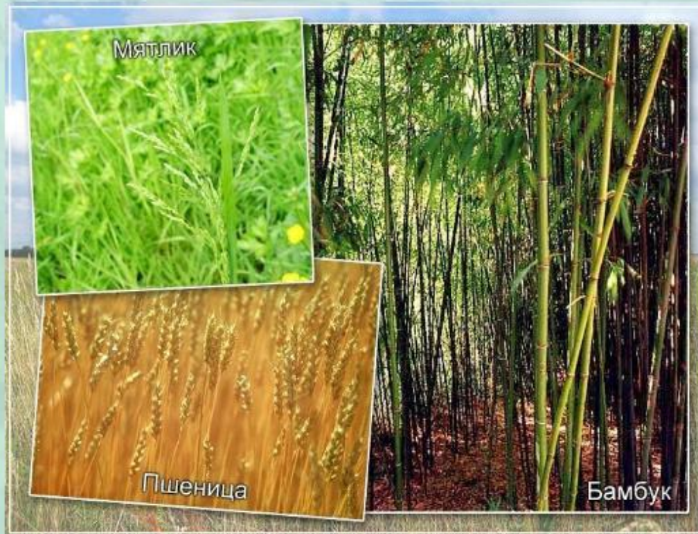
Растения семейства злаковых.

Помимо семейства лилейных, мы рассмотрим особенности растений семейства злаковых . Это одно из самых крупных семейств среди цветковых растений. В его состав входит более 10 000 видов растений.