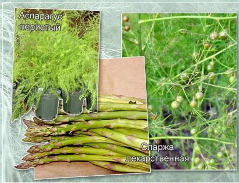
Побеги и плоды различных видов аспарагуса.

Различные виды спаржи (или аспарагуса) также относятся к лилейным. Среди них есть как корневищные растения, так и растения, образующие клубни.