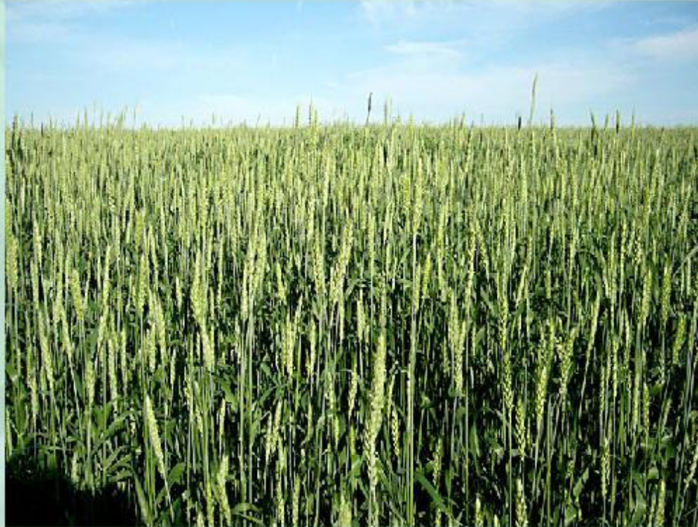
Поле цветущей пшеницы.

Затем начинается быстрый рост междоузлий ( вставочный рост побега). Побеги удлиняются - это называется выход в трубку . Уже после развития высоких побегов на них образуются соцветия, начинается цветение, а потом и созревание плодов.