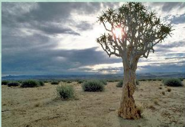
Дикорастущее алоэ в пустыне Карру (Африка).