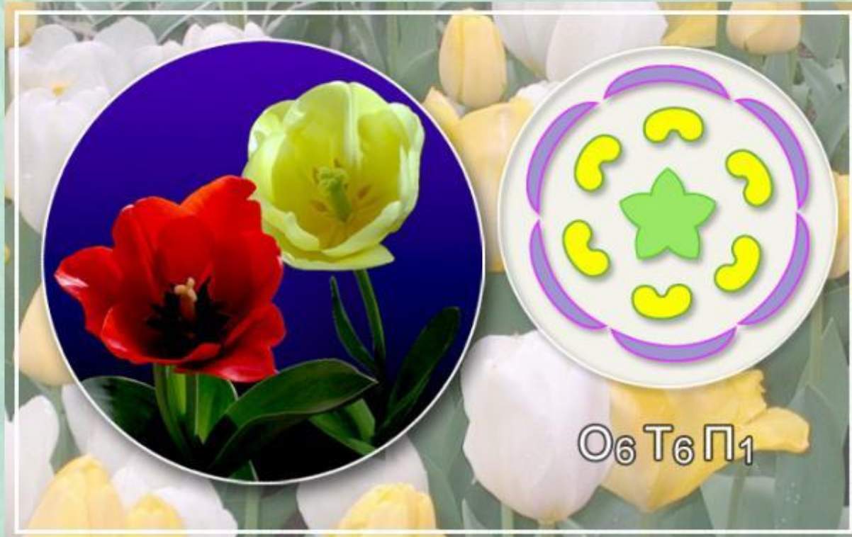
Строение и формула цветка тюльпана.

Цветок тюльпана - крупный, с яркой окраской. Его околоцветник простой, состоящий из 6 свободных листочков. Обозначим его O_6 . В цветках лилейных растений 6 тычинок и 1 пестик.