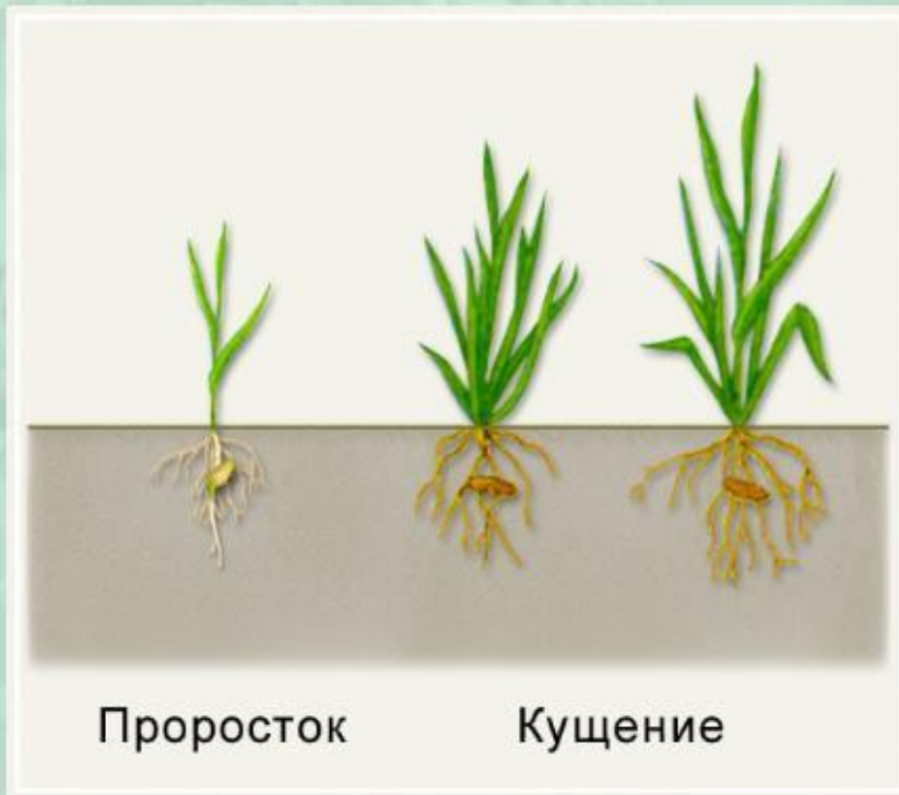
Стадии развития злаков.

В цикле развития многих злаков можно выделить определенные фазы: