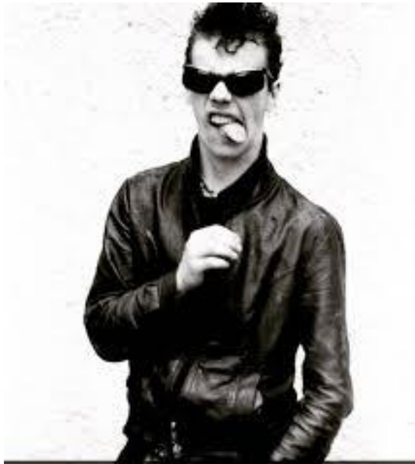
Бывший премьер- министр РФ Д.А. Медведев в молодости