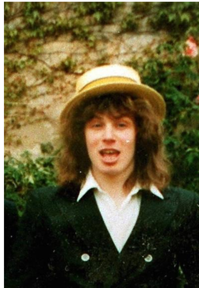
Бывший премьер-министр Великобритании Тони Блэр в молодости