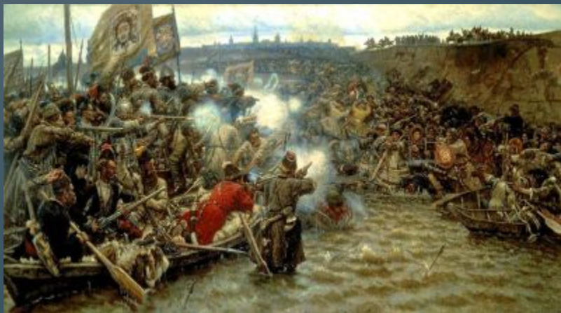
В.И.Суриков «Покорение Сибири Ермаком». 1895

В Русском музее можно посмотреть самые известные работы художников Кипренского, Венецианова, Карла Брюллова, И.И.Левитана, В.А.Серова, М.А.Врубеля, М.В.Нестерова, В.И.Сурикова и многих, многих других художников.