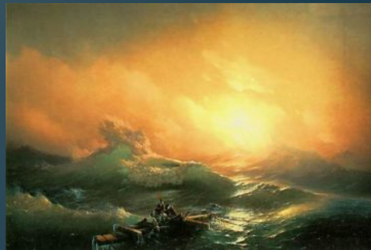
И.К.Айвазовский «Девятый вал». 1850