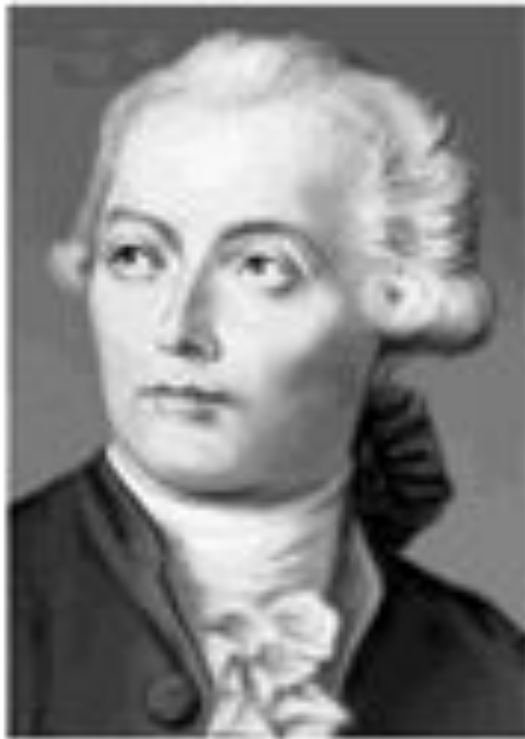
Антуан Лоран ЛАВУАЗЬЕ (1743-1794)

Один из нас является первооткрывателем этого газа , а другой определил, что этот горючий газ образован новым химическим элементом и дал ему название.