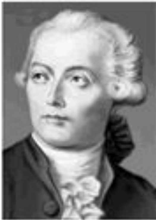
Антуан Лоран ЛАВУАЗЬЕ (1743-1794)

Один из нас является первооткрывателем этого газа , а другой определил, что этот горючий газ образован новым химическим элементом и дал ему название.