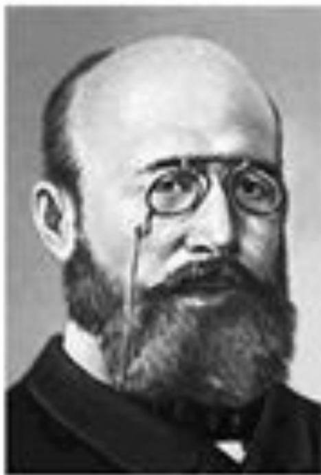
Александр Михайлович БУТЛЕРОВ (1823-1886)

Изучение состояния химической науки за рубежом, собственные экспериментальные работы привели меня к важной научной идее.