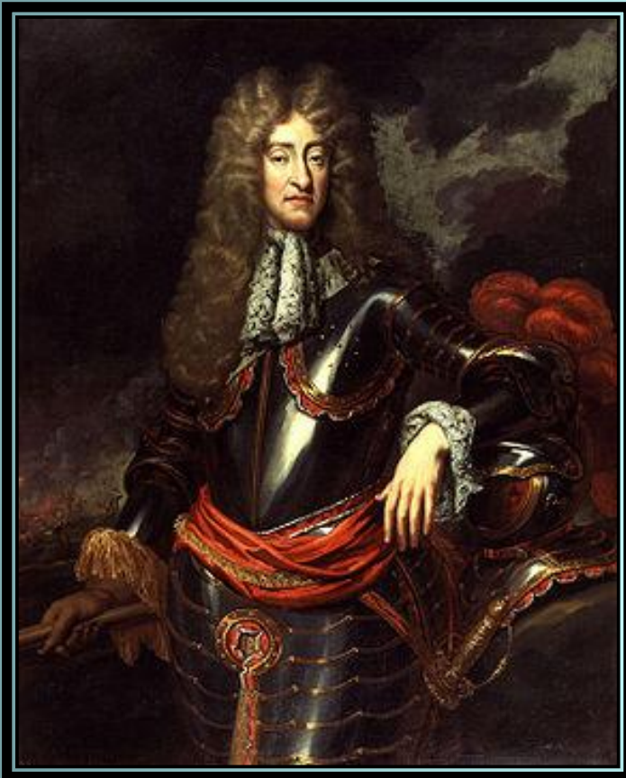
Вильгельм III Оранский