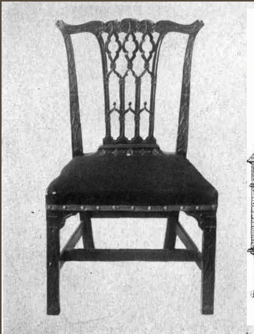
Недорогой «готический» стул под Чиппендейла