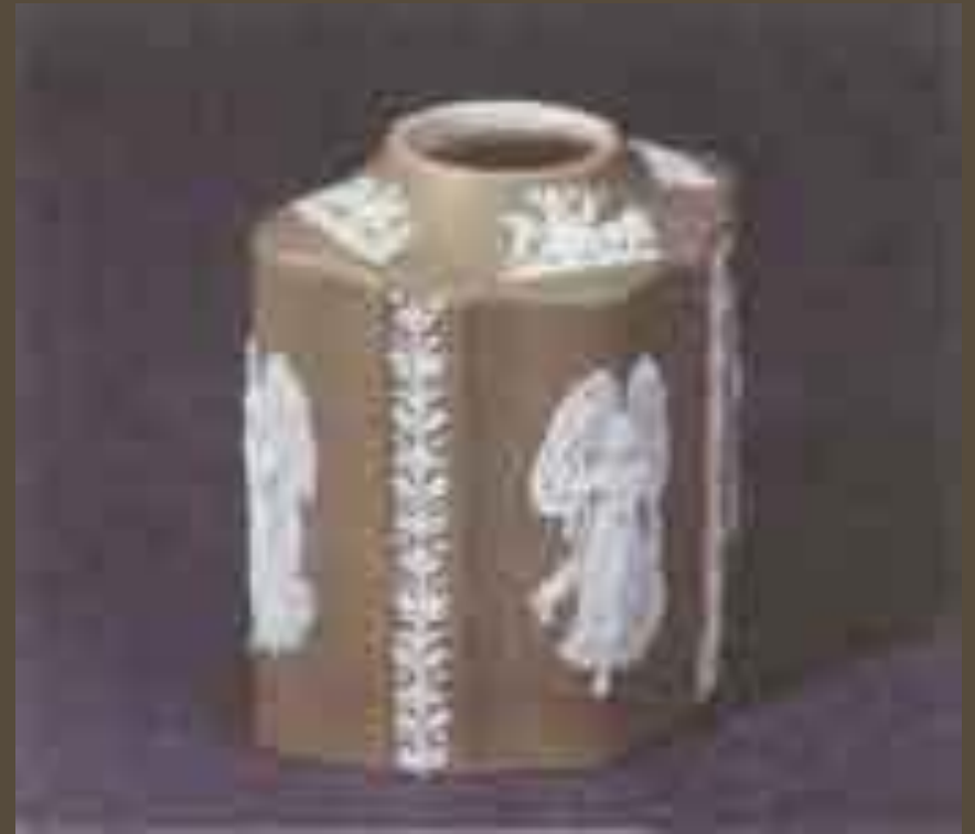
Фарфор фирмы «Веджвуд». XVIII в.

В области скульптуры в Англии в 18 века не было создано ничего выдающегося. Но именно это время – период высокого подъема декоративно-прикладного искусства: торевтики (обработка металлов), обработки стекла и особенно производства фарфора. Английское декоративно прикладное искусство получило в XVIII в. общеевропейское признание. Прежде всего, это относится к изготовлению посуды и мебели.