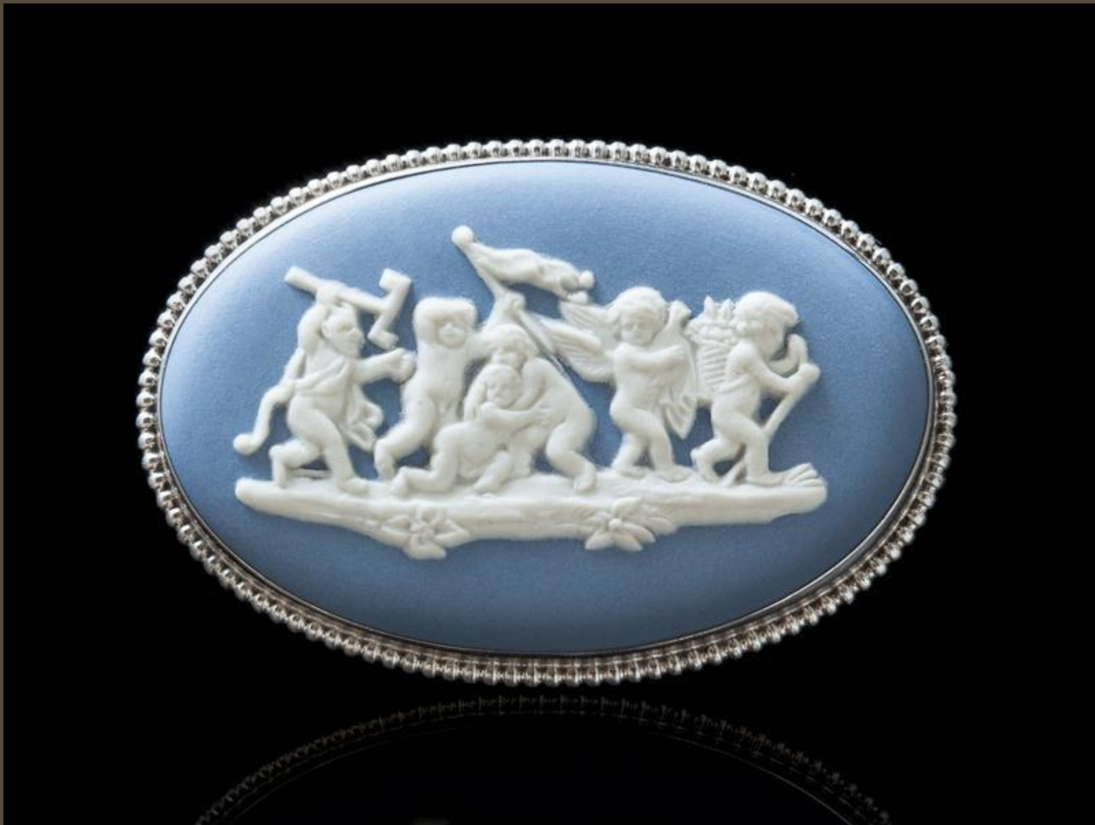
Брошь фирмы «Веджвуд». XVIII в.