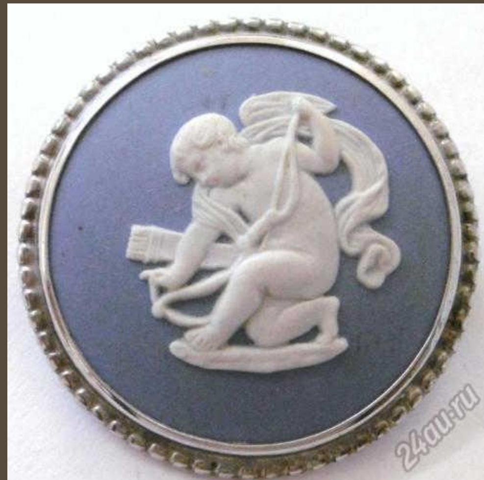
Брошь фирмы «Веджвуд». «Амур» XVIII в.

В конце XVIII в. Веджвуд изобрёл особую керамическую массу, позволяющую создавать сверхпрочные изделия с очень тонкими стенками. Из этого материала он делал копии знаменитых античных камей (драгоценных и полудрагоценных камней с выпуклым изображением) и рельефов в духе неоклассицизма. Строгие композиции с белыми фигурками на цветном фоне вешали на стены, ставили на стол или украшали ими спинку кресла, что придавало интерьеру столь популярный в ту эпоху античный колорит.