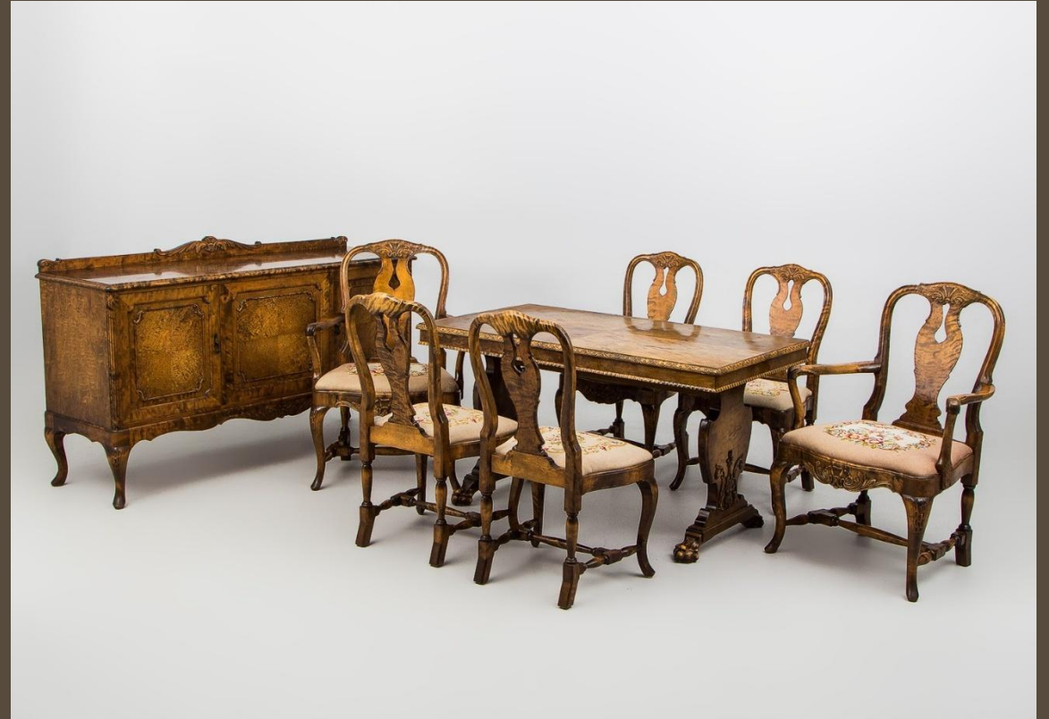
Мебель фирмы «Чиппендейл». Копия XVIII в

Английская мебель, славившаяся своей элегантностью и высоким качеством, изготавливалась с учётом особенностей того или иного стиля в современном искусстве. Изделия фирмы Томаса Чиппендейла (1718— 1779) тесно связаны со стилем рококо. Мастера использовали до блеска отполированное красное дерево, прихотливо изгибая спинки и ножки в виде звериных лап. Однако в отличие от изделий французского рококо мебель Чиппендейла очень удобна и практична.