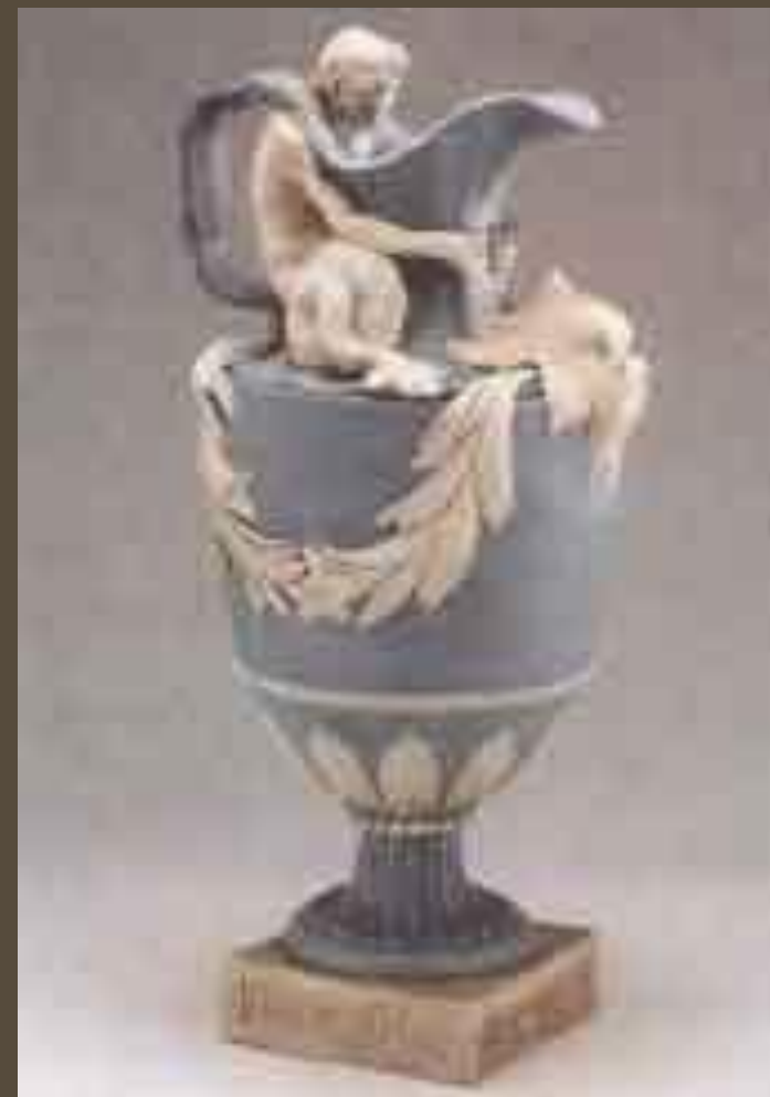
Кувшин фирмы «Веджвуд». XVIII в. Государственный Эрмитаж, СанктПетербург.

В середине столетия Джозайя Веджвуд (1730—1795) создал новую технологию производства фаянса. Фаянсовые изделия традиционно считались более грубыми, чем фарфоровые, и ценились дешевле. Но фаянс Веджвуда по тонкости и изяществу соперничал с фарфором. Веджвудские сервизы, расписанные изысканными, нежными по колориту видами английских усадеб с парками, особняками, замками, стали пользоваться огромной популярностью в Европе.