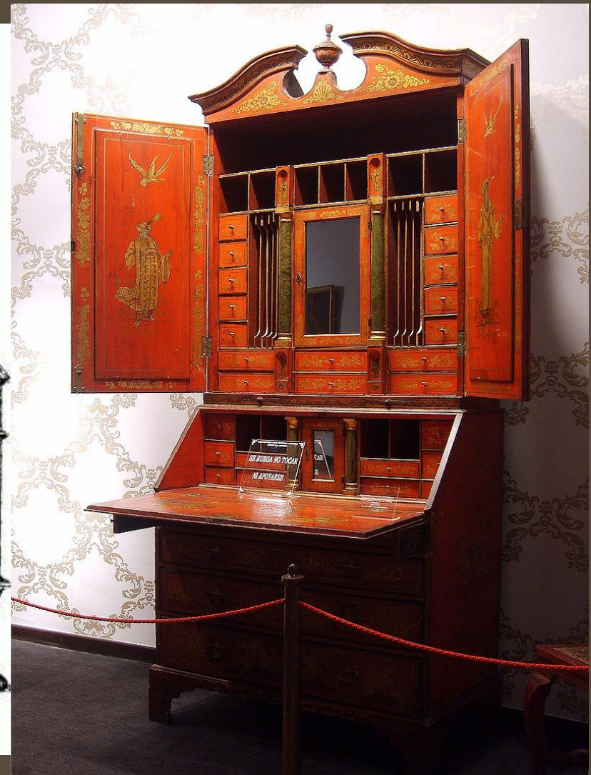
Чиппендейловский кабинет для домашних занятий