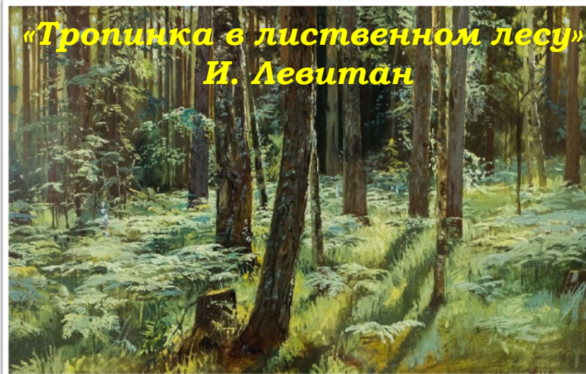
«Тропинка в лиственном лесу» И. Левитан