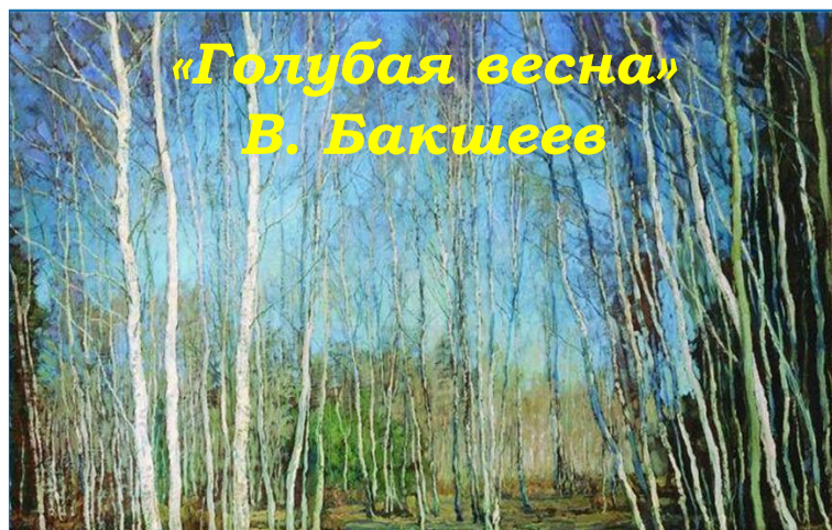
«Голубая весна» В. Бакшеев

Лес привлекает мастеров пера и кисти своей таинственностью и многообразием красоты весной, летом, осенью и зимой. Особые чувства вызывают темно-хвойный лес и многоцветная дубрава, веселая березовая роща и светлый кедровник.