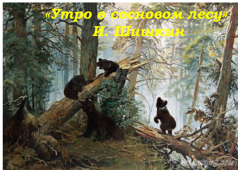
«Утро в сосновом лесу» И. Шишкин