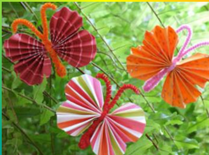
Идея № 3: