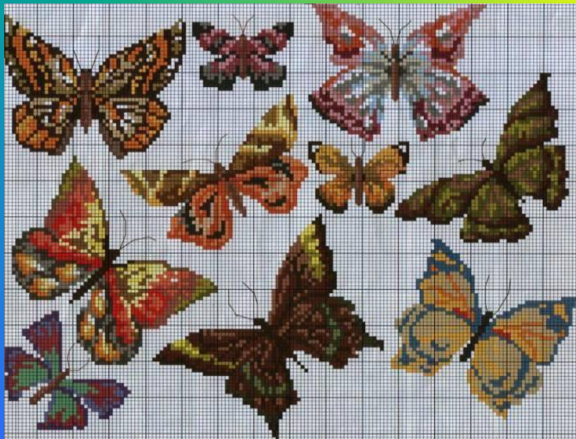
Идея № 3: