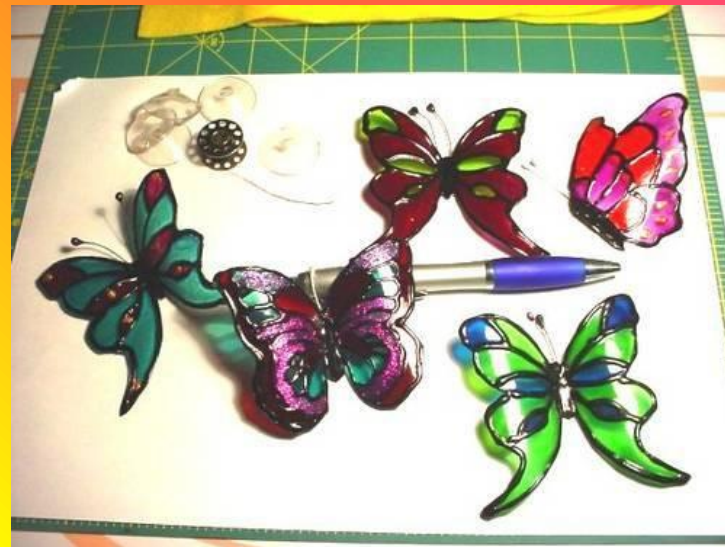
Идея № 4: