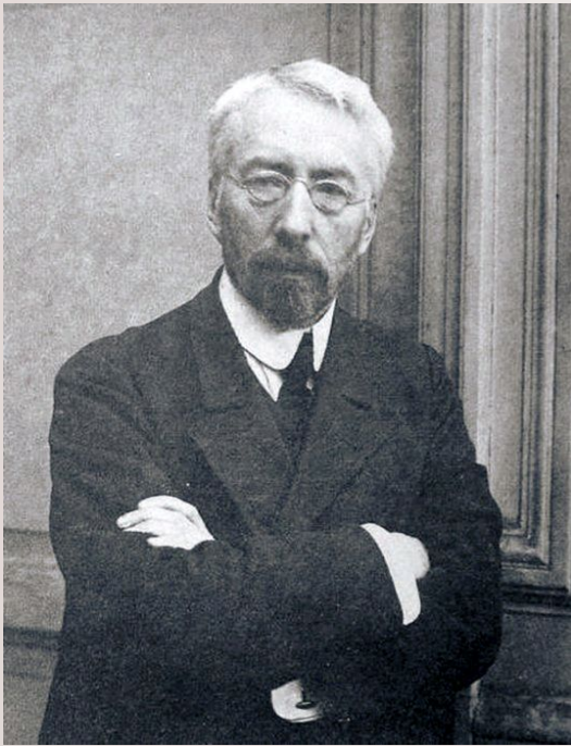
В. Л. Бурцев

А так же историк революции В. Л. Бурцев, знавший Голощёкина, сказал о нём: «Это типичный ленинец. Это человек, которого кровь не остановит. Эта черта особенно заметна в его натуре: палач, жестокий, с некоторыми элементами дегенерации. В партийном быту он отличался высокомерием, был демагогом, циником. Казахам он вообще за людей не считал. Не успел Голощёкин появиться в Казахстане, как заявил, что советской власти тут нет и надо устроить «Малый Октябрь»»