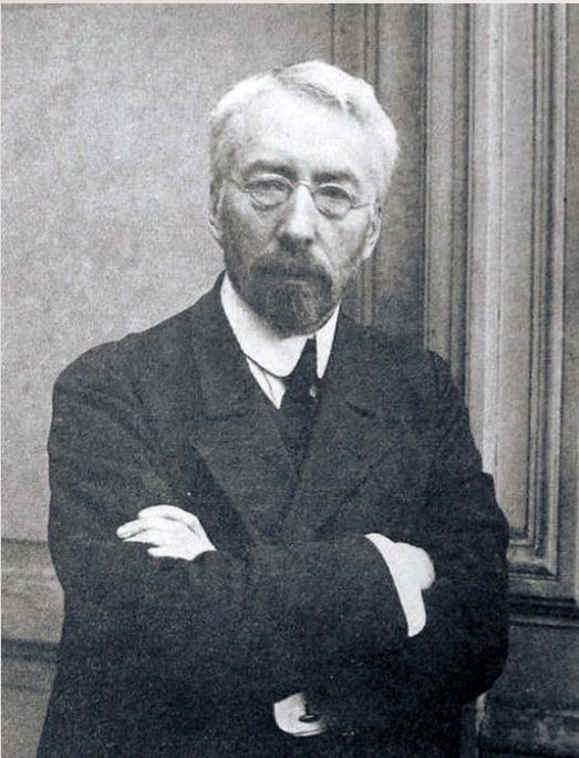
В. Л. Бурцев

А так же историк революции В. Л. Бурцев, знавший Голощёкина, сказал о нём: «Это типичный ленинец. Это человек, которого кровь не остановит. Эта черта особенно заметна в его натуре: палач, жестокий, с некоторыми элементами дегенерации. В партийном быту он отличался высокомерием, был демагогом, циником. Казахам он вообще за людей не считал. Не успел Голощёкин появиться в Казахстане, как заявил, что советской власти тут нет и надо устроить «Малый Октябрь»»