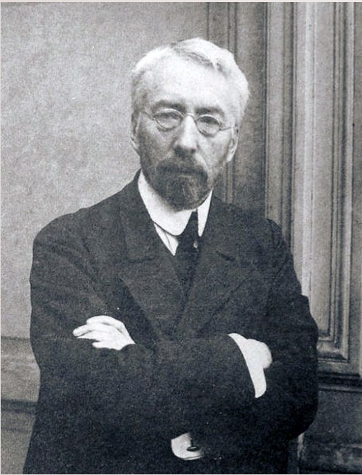
В. Л. Бурцев

А так же историк революции В. Л. Бурцев, знавший Голощёкина, сказал о нём: «Это типичный ленинец. Это человек, которого кровь не остановит. Эта черта особенно заметна в его натуре: палач, жестокий, с некоторыми элементами дегенерации. В партийном быту он отличался высокомерием, был демагогом, циником. Казахам он вообще за людей не считал. Не успел Голощёкин появиться в Казахстане, как заявил, что советской власти тут нет и надо устроить «Малый Октябрь»»