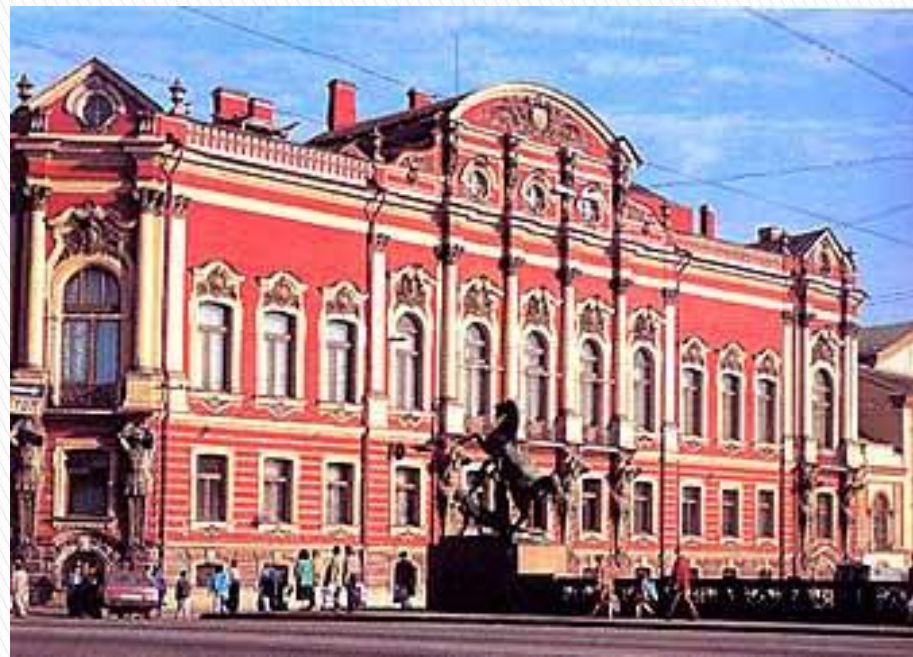
Дворец Белосельских- Белозёрских