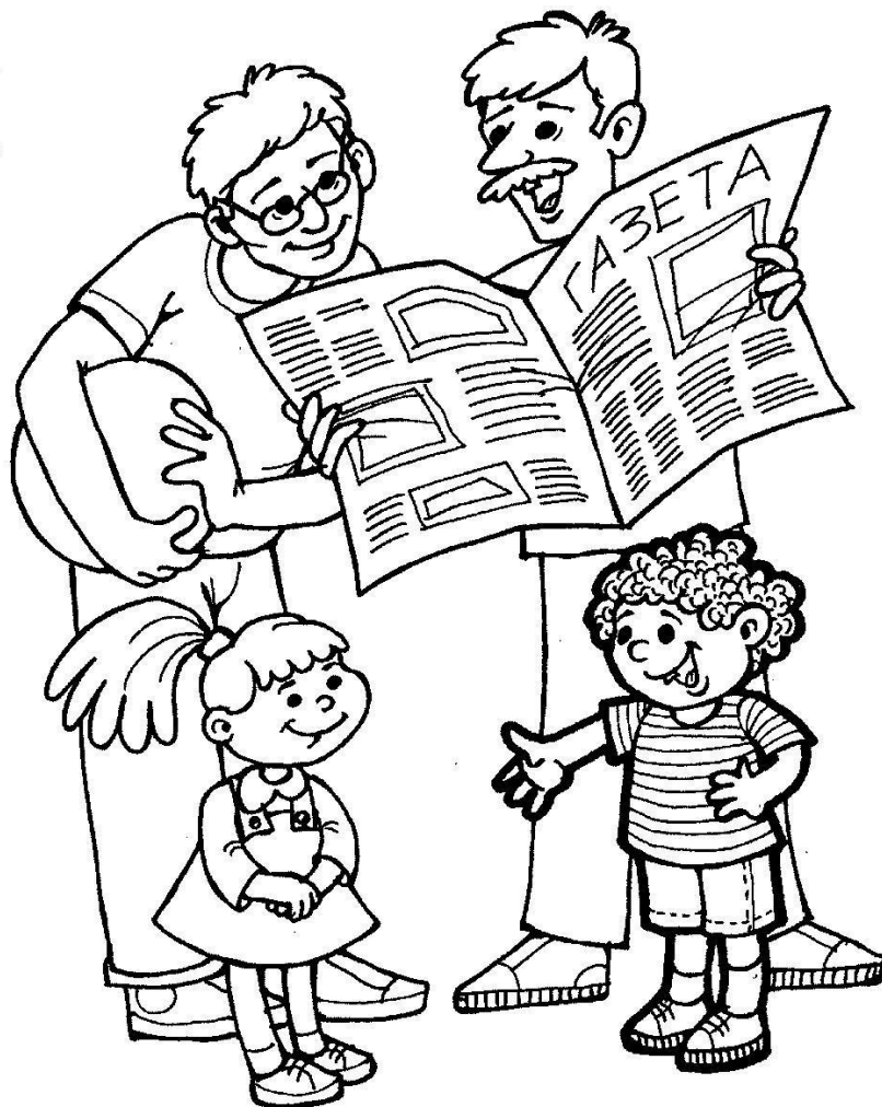
Парная картинка на стр. 12

Этот человек не боится начинать делать то, что задумал. Такому человеку не страшны препятствия, неудачи. Он сможет всё преодолеть.