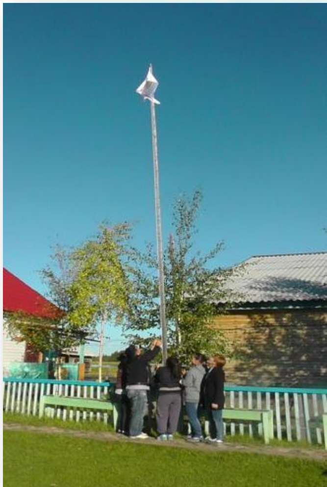
Открытие лагеря, поднятие флага «СунАМП»