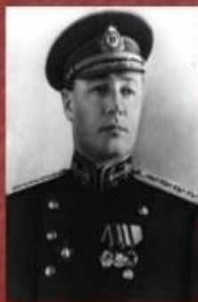
Николай Герасимович Кузнецов