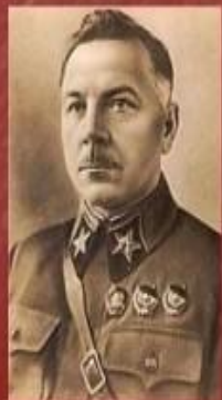
Климент Ефремович Ворошилов

Осуществляла общее руководство фронтами.