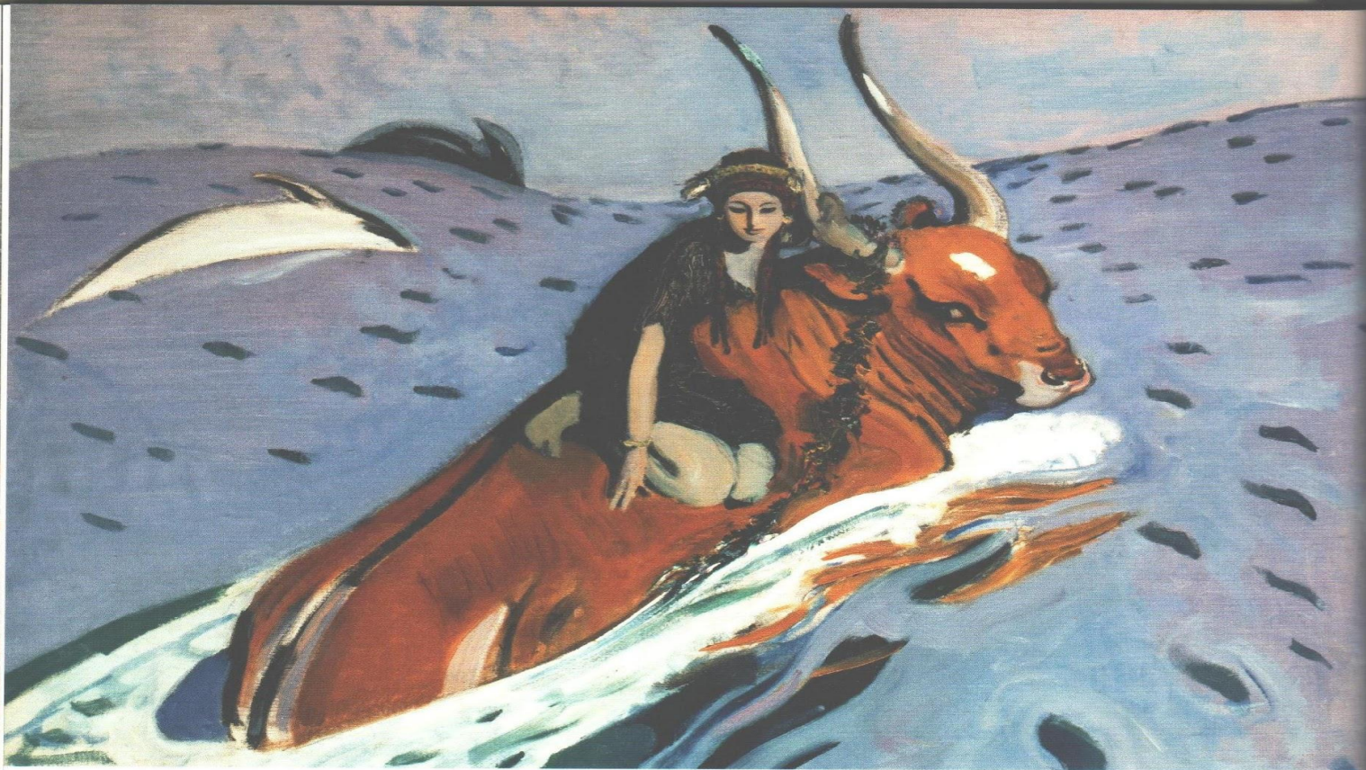
Валентин Серов. Похищение Европы. 1910 ▲