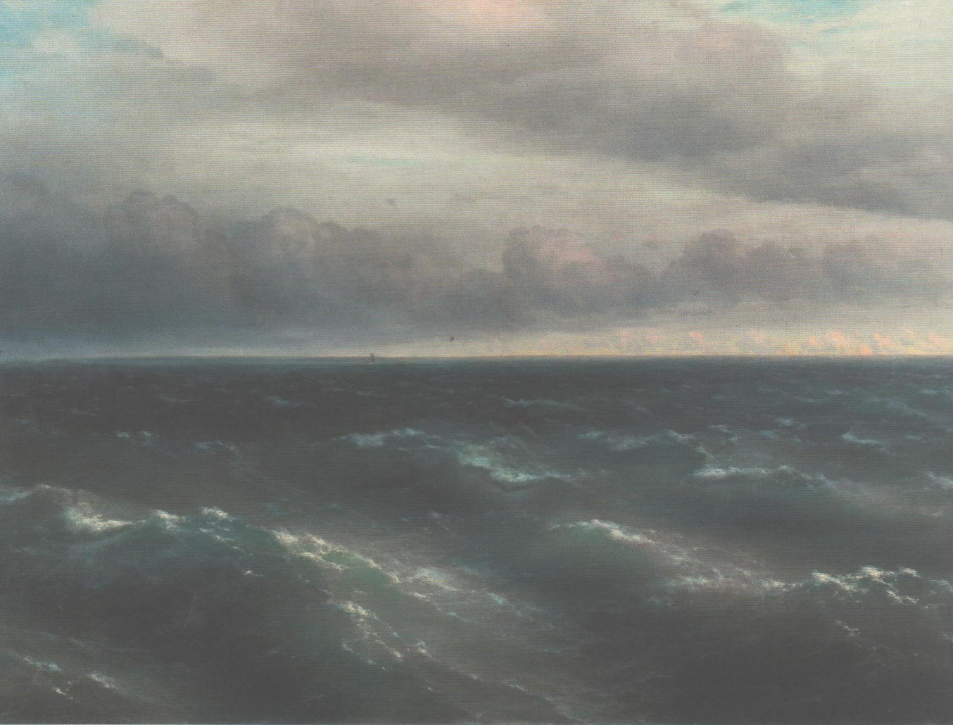
▲ Иван Айвазовский. Чёрное море (На Чёрном море начинает разыгрываться буря). 1881