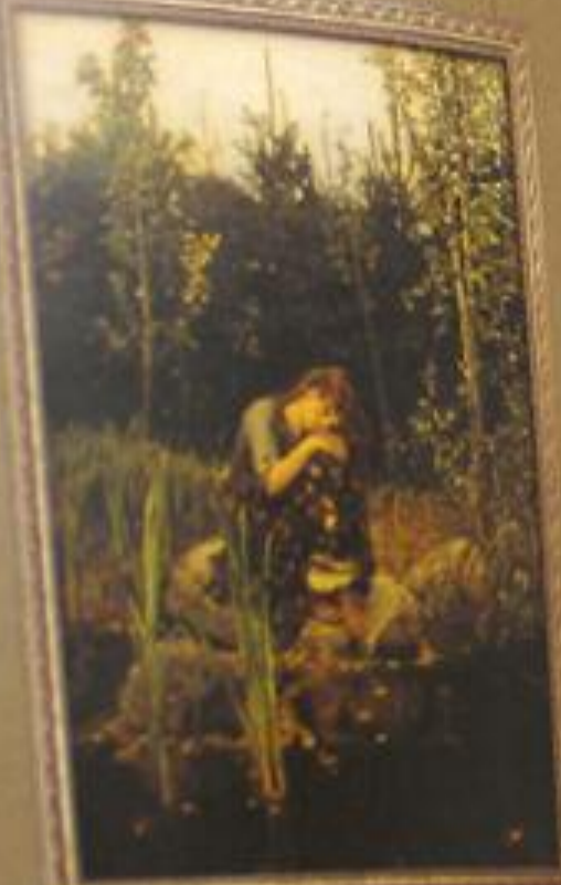
В. К. Васильев АЛЕНУШКА 1901