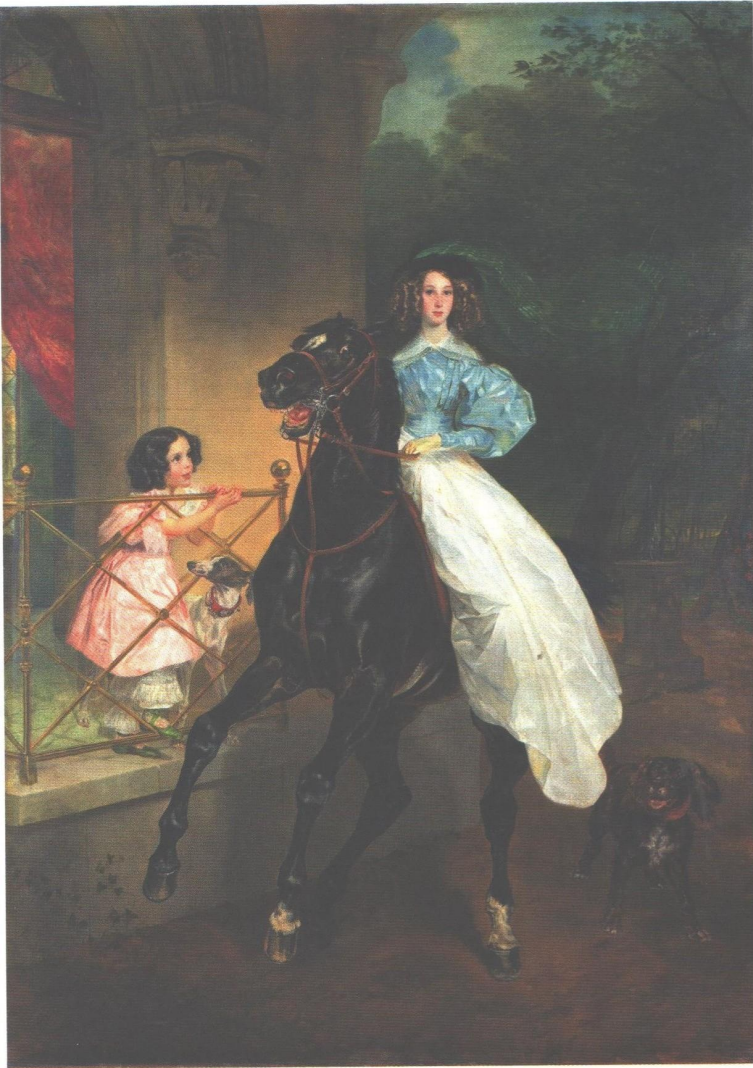
▲ Карл Брюллов. Всадница. 1832

И младшая прелестна, И превосходна всадница, А лошадь, скажем честно, Настоящая красавица!