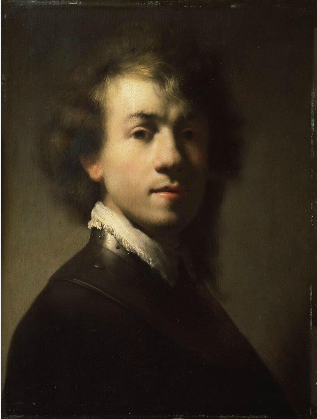
РЕМБРАНДТ ХАРМЕНС ВАН РЕЙН АВТОПОРТРЕТ В 23 ГОДА, 1629