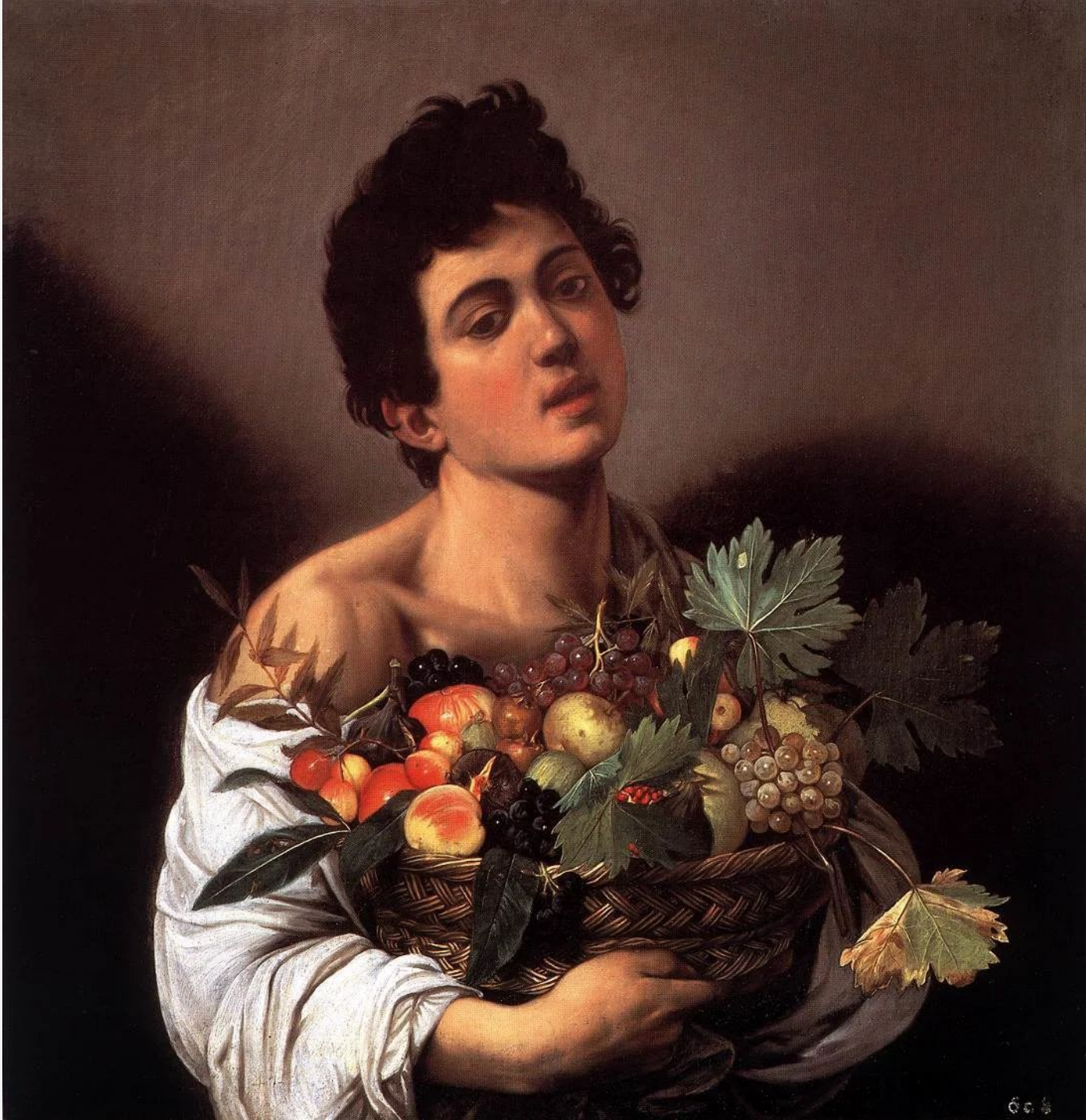
КАРАВАДЖО «ЮНОША С КОРЗИНОЙ ФРУКТОВ», 1593