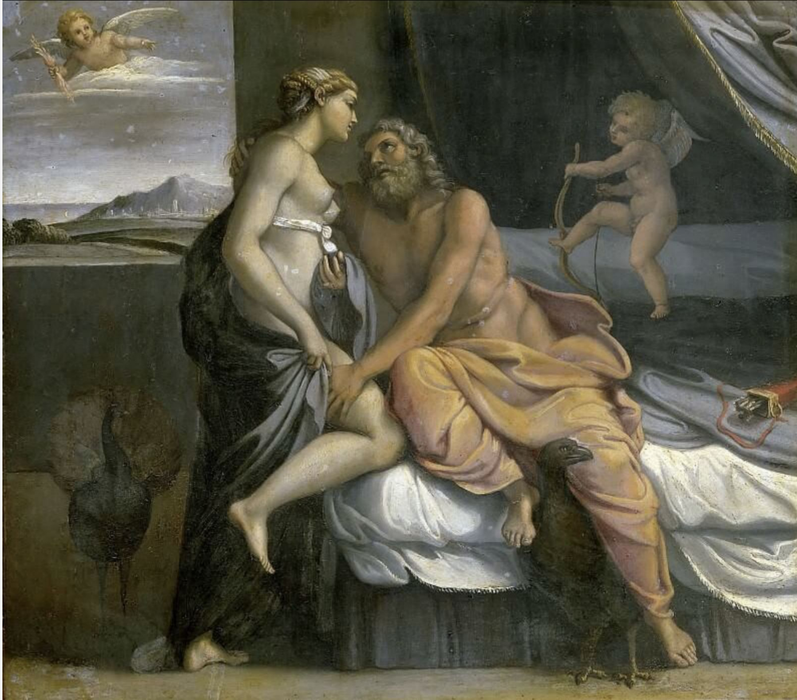
АННИБАЛЕ КАРРАЧЧИ «ЮПИТЕР И ЮНОНА»