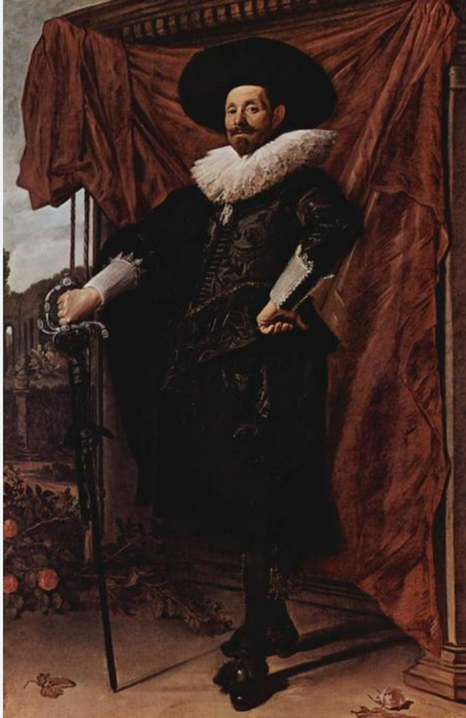
ФРАНС ХАЛС «ПОРТРЕТ ВИЛЛЕМА ХЕЙТХЕЙССЕНА» (1625-1630).