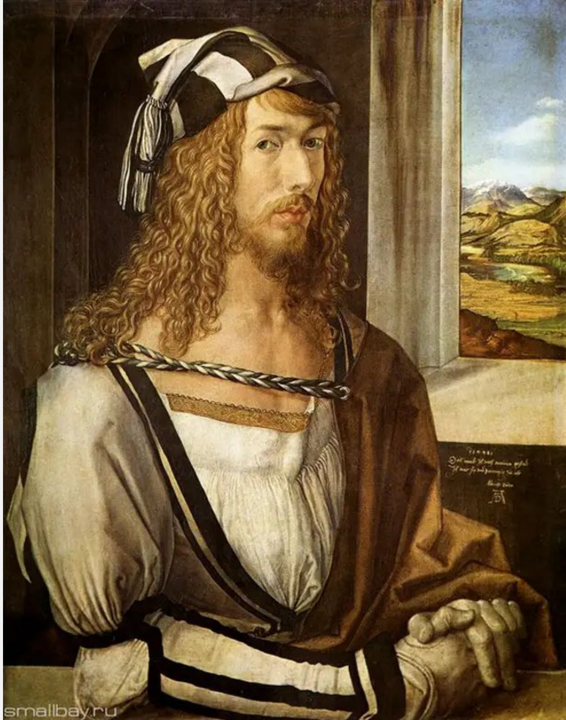
АЛЬБРЕХТ ДЮРЕР, «АВТОПОРТРЕТ», 1500