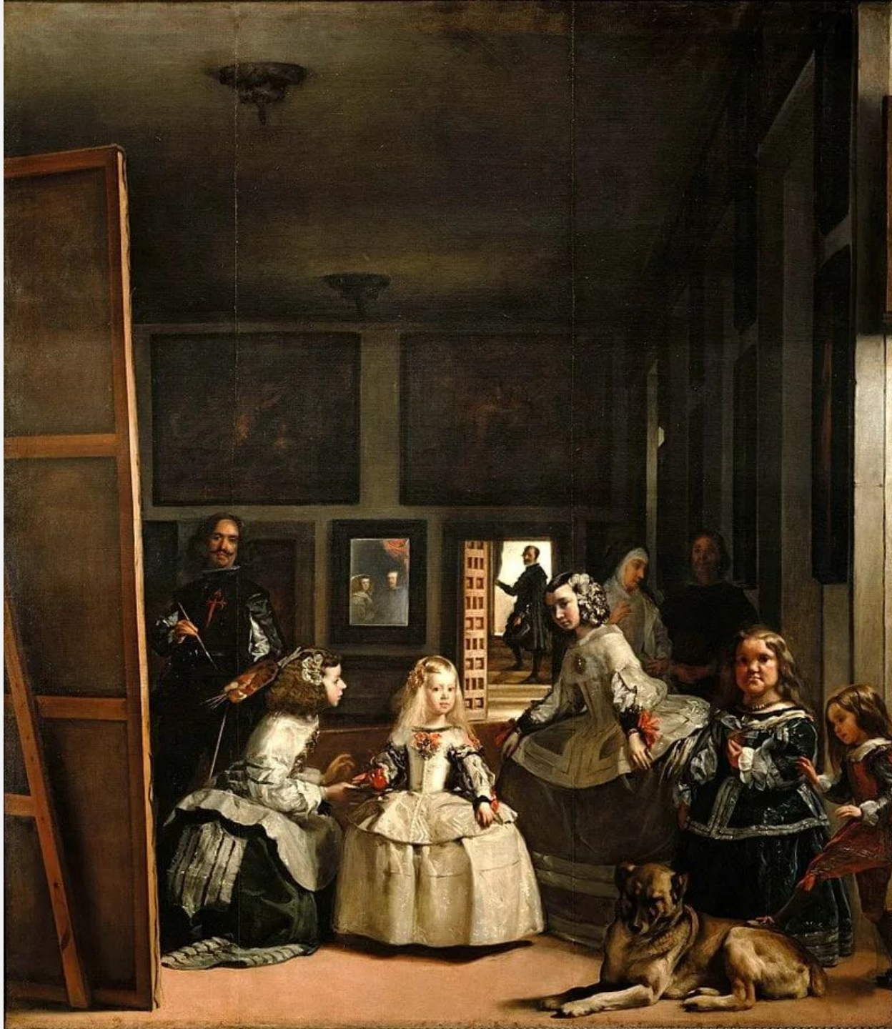
ДИЕГО ВЕЛАСКЕС «МЕНИНЫ»