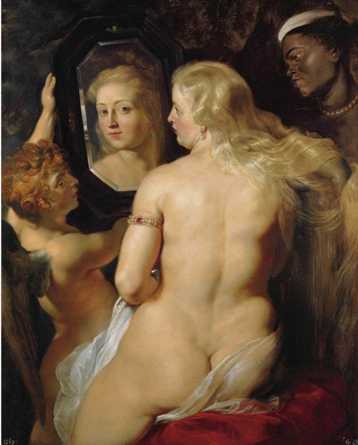
ЖИВОПИСЬ В СТИЛЕ БАРОККО: «ТУАЛЕТ ВЕНЕРЫ», ПИТЕР ПАУЛЬ РУБЕНС