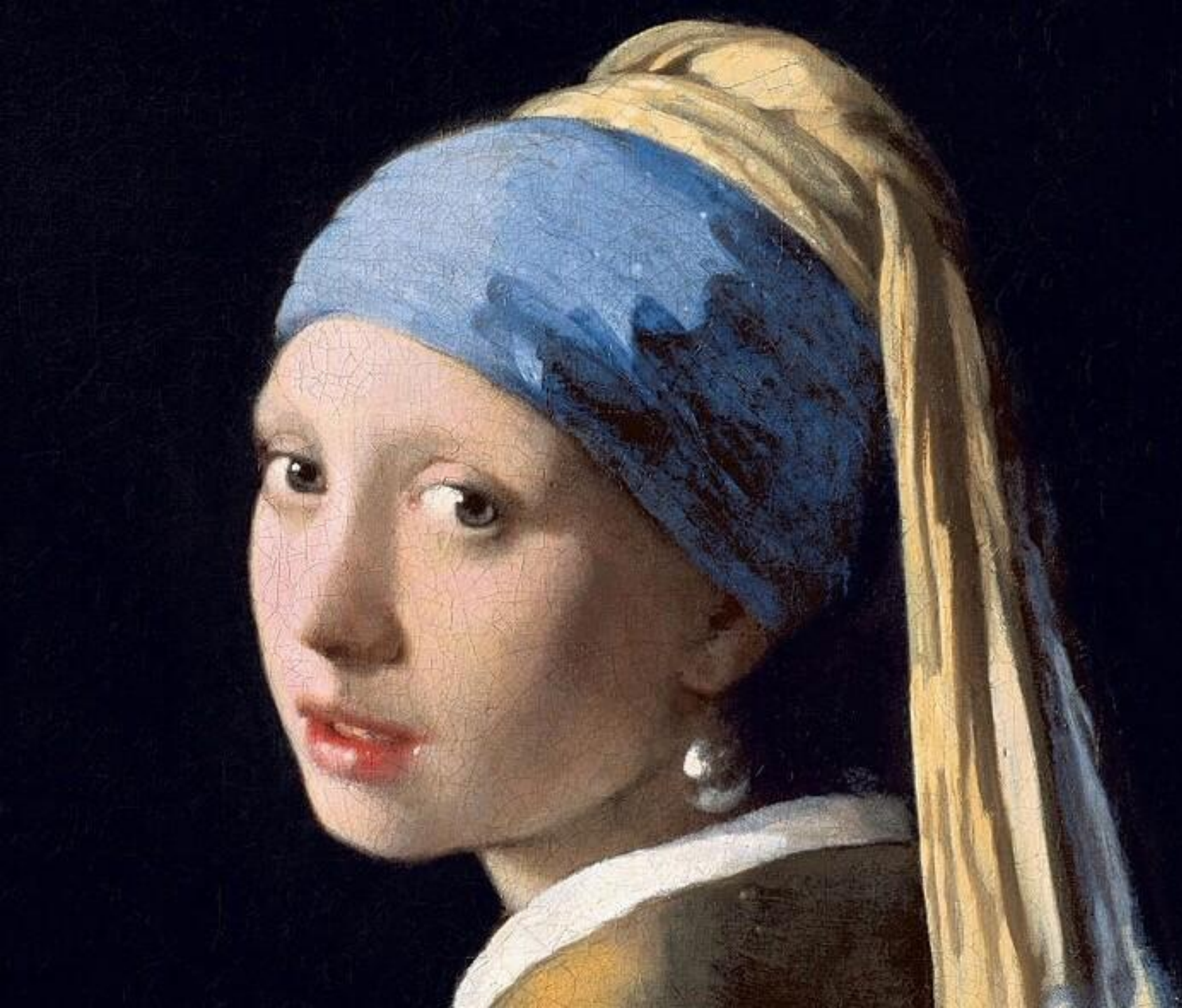
ЯН ВЕРМЕЕР «ДЕВУШКА С ЖЕМЧУЖНОЙ СЕРЁЖКОЙ»