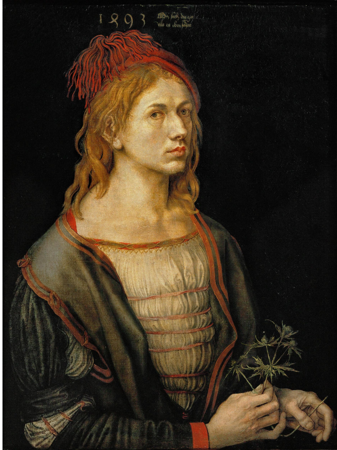
«АВТОПОРТРЕТ С ЧЕРТОПОЛОХОМ», 1493, ЛУВР, ПАРИЖ.