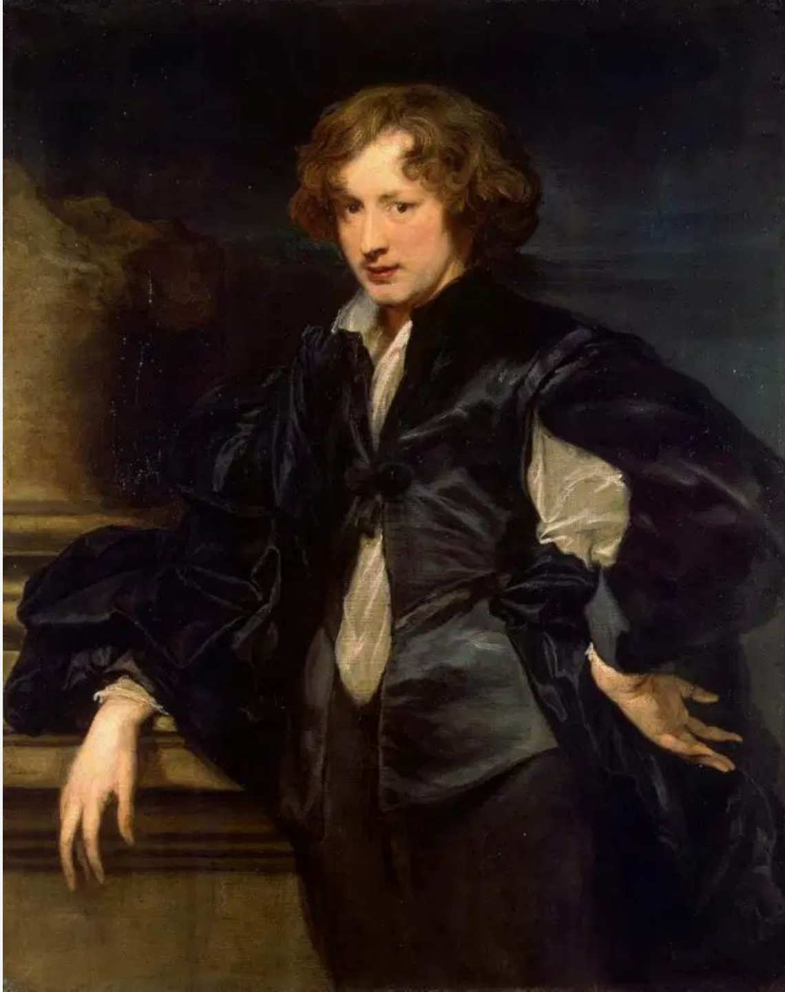
АНТОНИС ВАН ДЕЙК. АВТОПОРТРЕТ. 1622-1623 ГГ. ГОСУДАРСТВЕННЫЙ ЭРМИТАЖ.