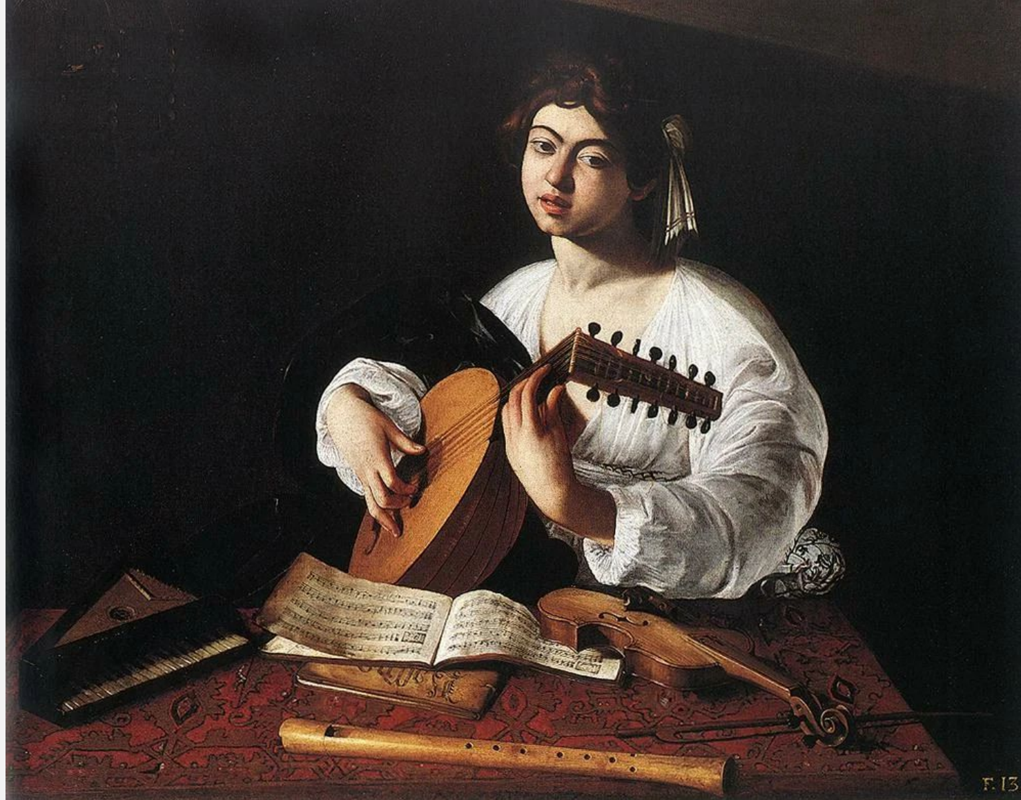
КАРАВАДЖО «ЛЮТНИСТ», 1595