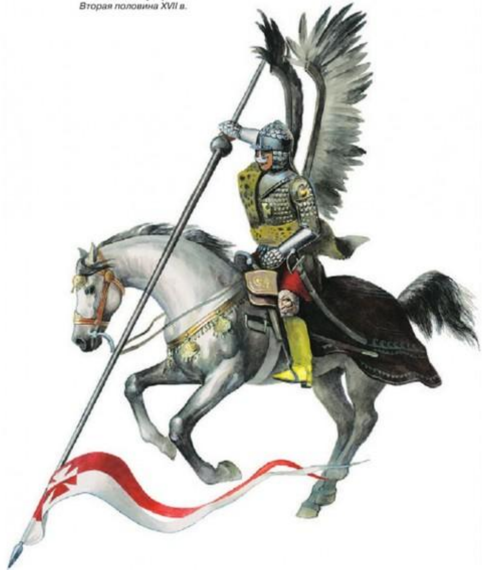
Польский гусар. Вторая половина XVII в.

Кольчужники и латники – Воины, одетые в кольчуги и латы