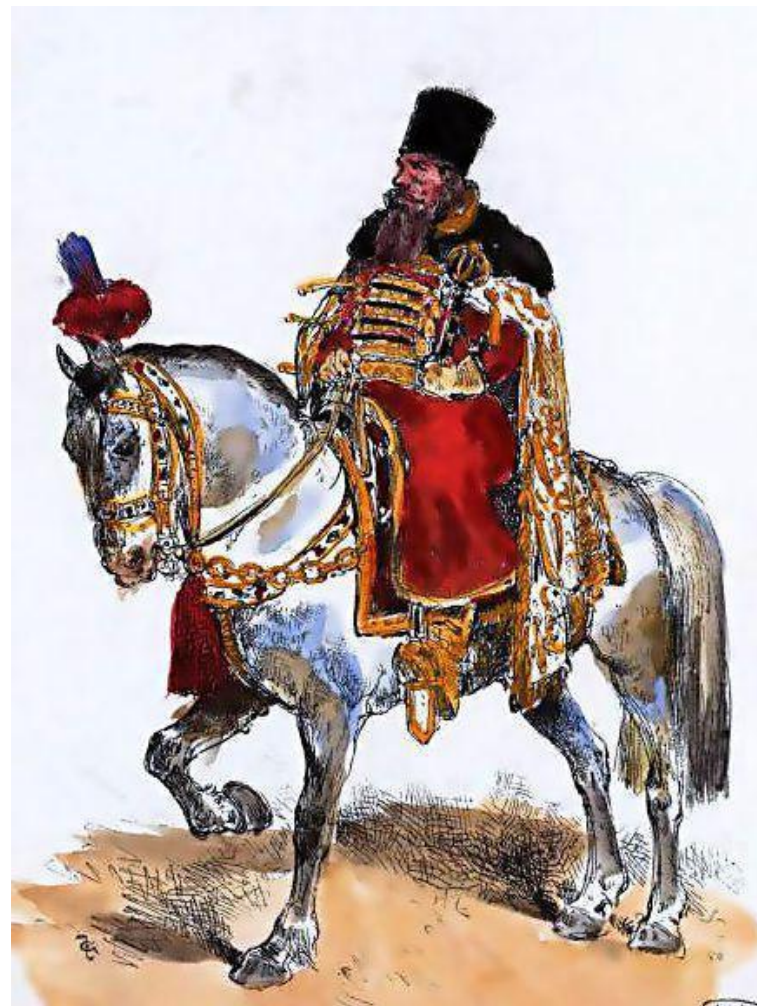
Воевода – начальник города