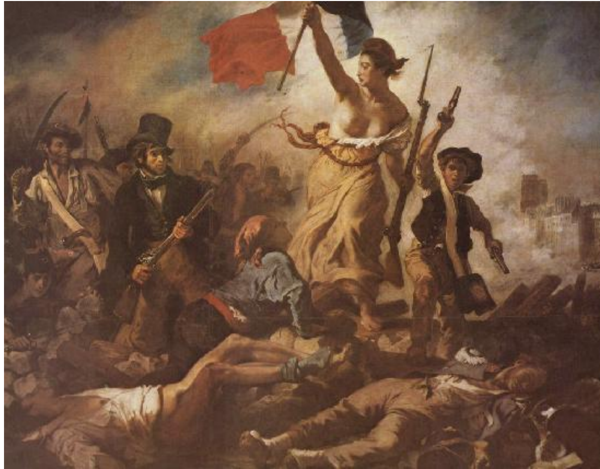
Э. Делакруа «Свобода на баррикадах»