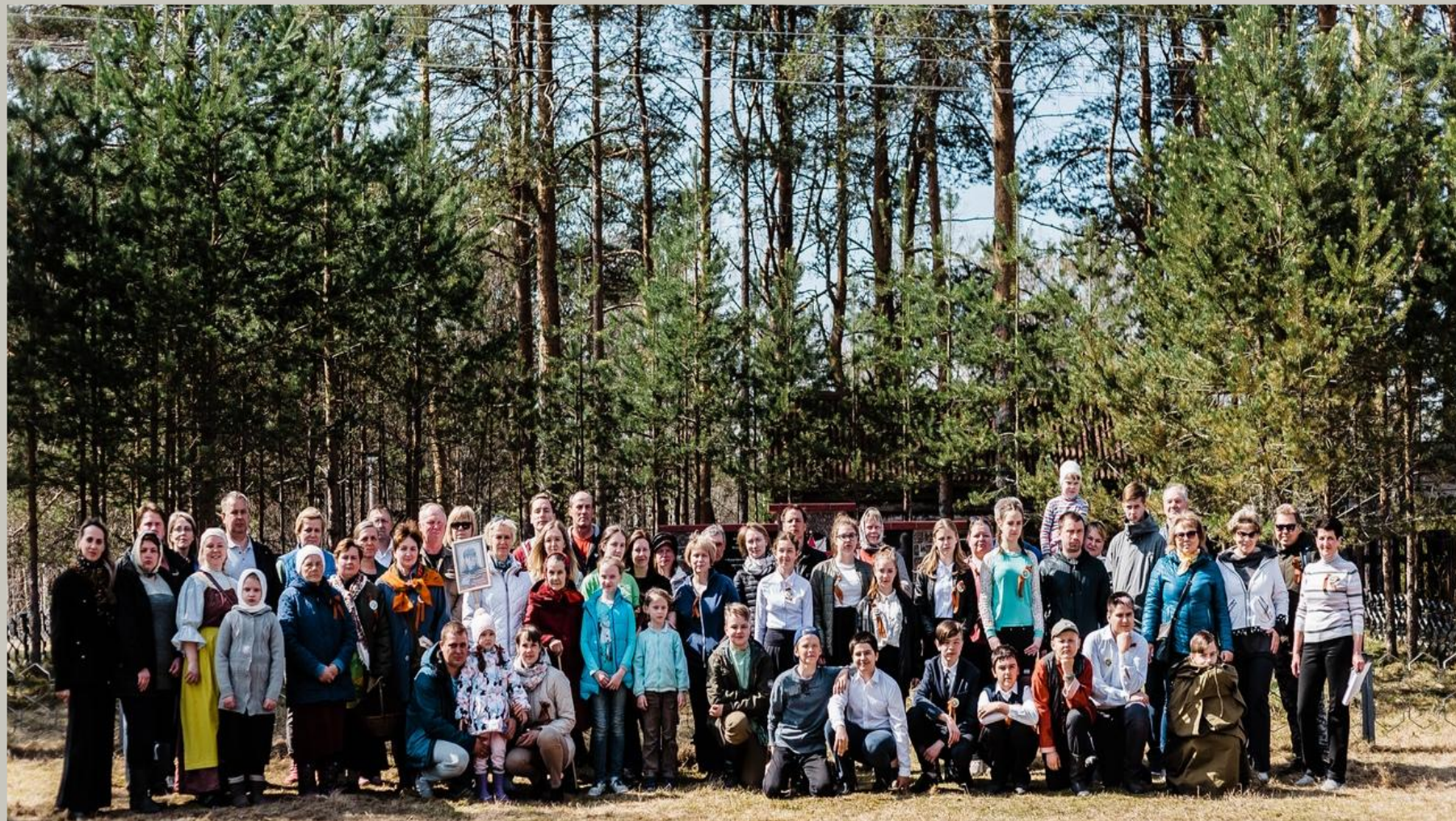
10 мая 2019 года Жители деревни, ученики Пряжинской школы, активисты ТОС