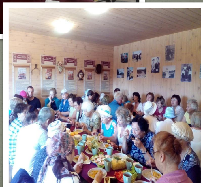
В гостях детки Центра «Надежда» и целевая группа Дети войны и ЖБЛ