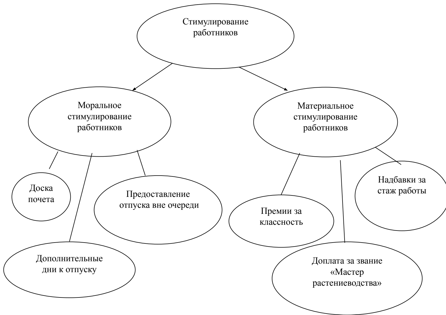
Рисунок 2 – Виды стимулирования работников в КФХ Сошко В.А.