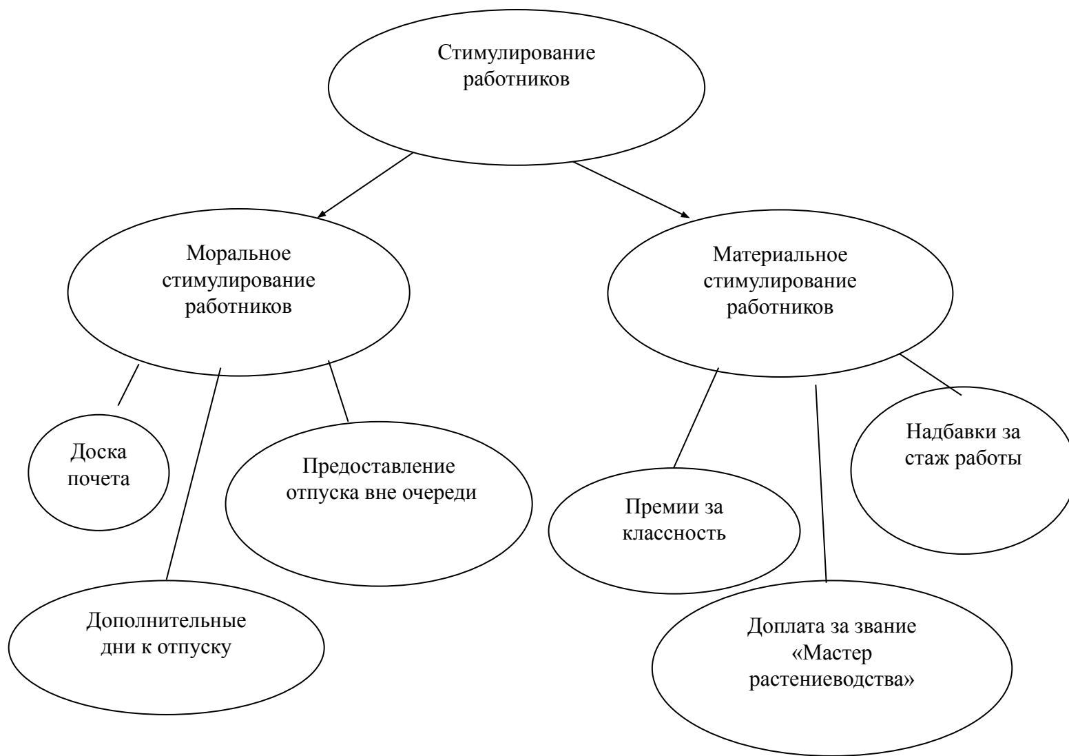
Рисунок 2 – Виды стимулирования работников в КФХ Сошко В.А.