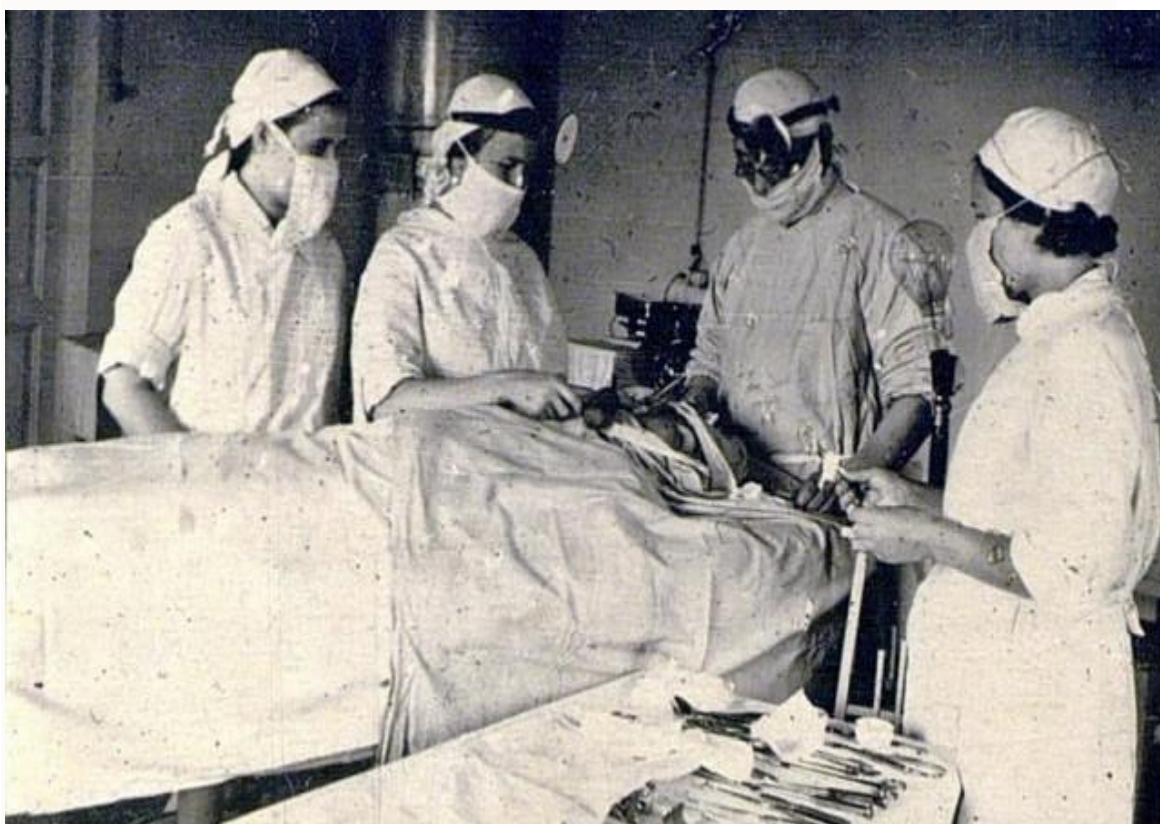
Тыловой госпиталь в Пенза