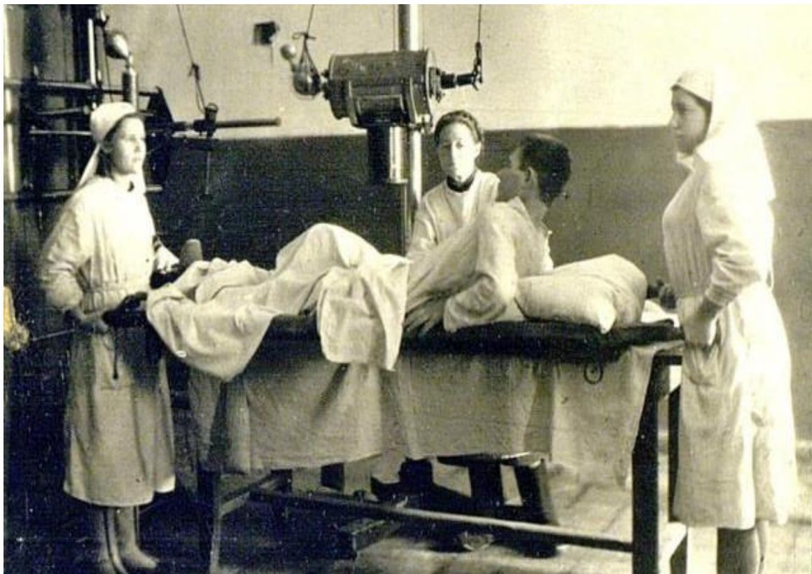
Госпиталь в Пензе