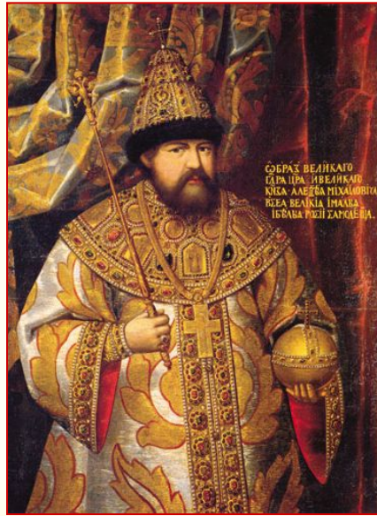
Алексей Михайлович Романов (1645-1676)