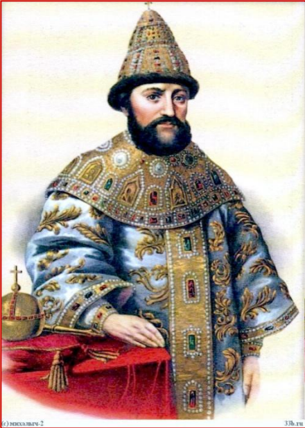
Михаил Федорович Романов (1613-1645)