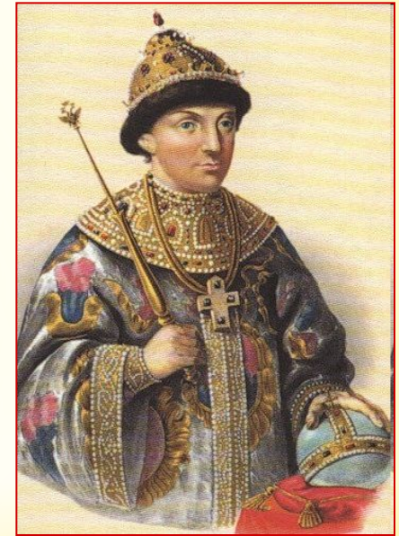
Федор Алексеевич Романов (1676-1682)