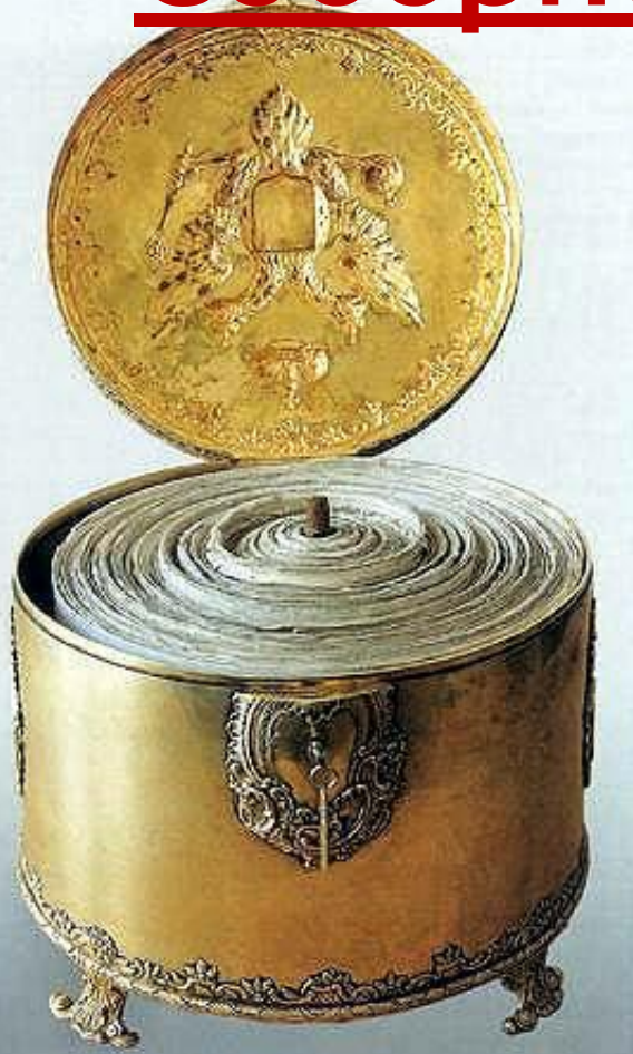
Соборное Уложение Свиток, 343 аршина. Центральный Гос. архив Древних Актов (ЦГАДА)