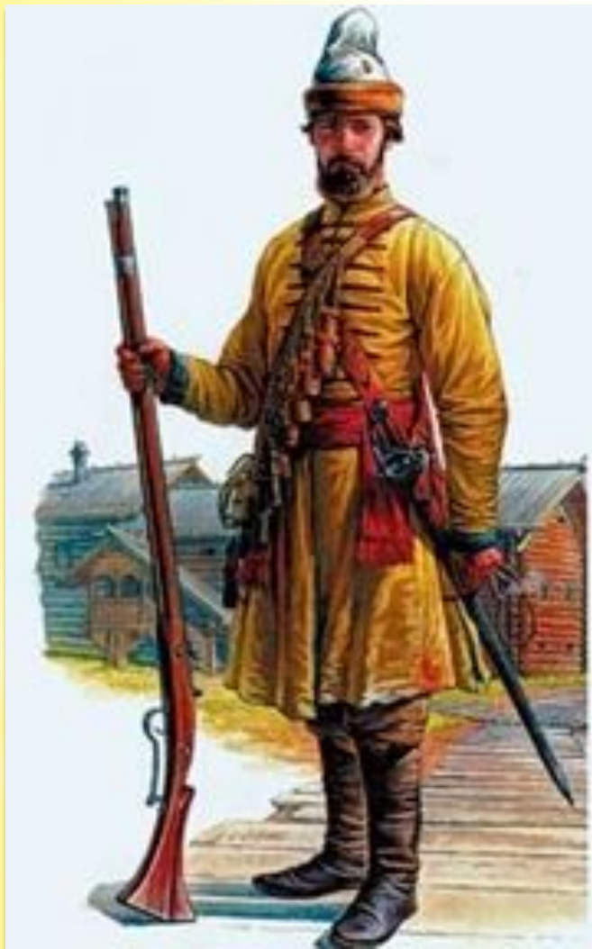
Солдат полка нового (иноземного) строя.

В 1631 г. в Москве были сформированы два первых полка нового(иноземного) строя.