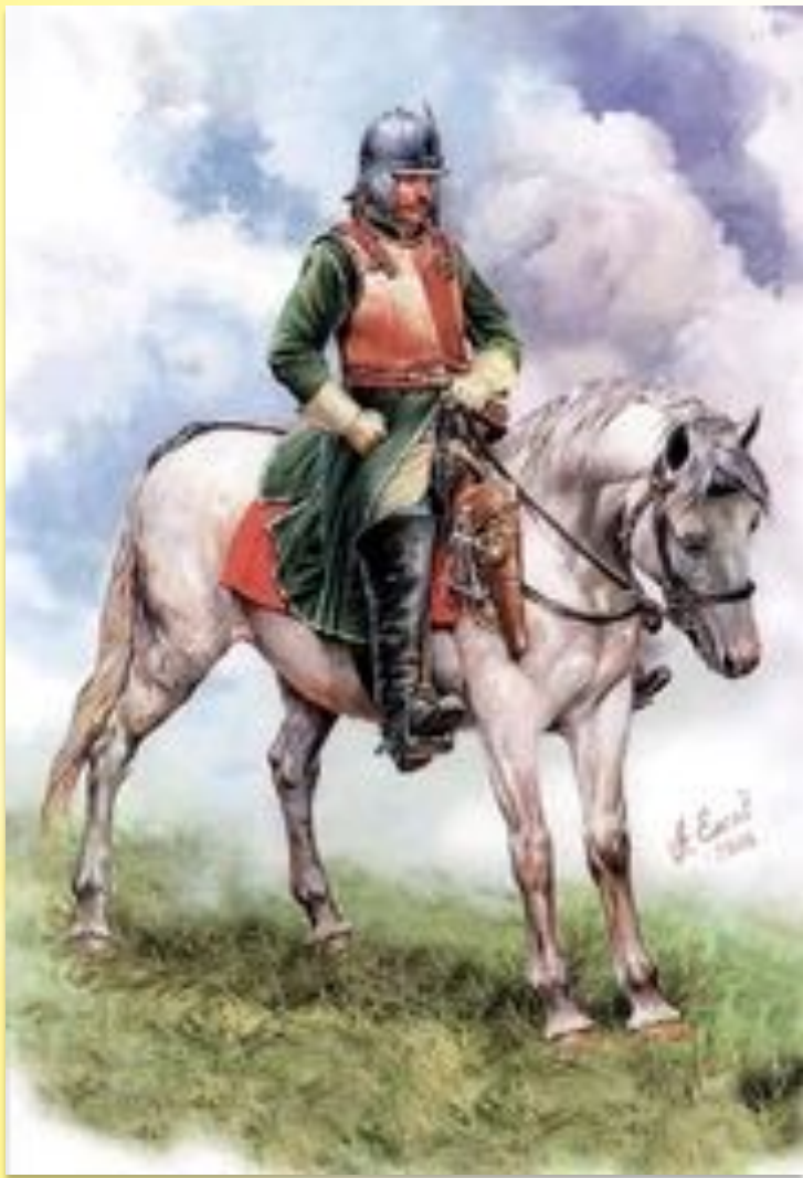
Офицер рейтарского полка

Рейтарами становились мелкопоместные или беспоместные дворяне, которые за свою службу получали денежное жалованье или поместье.