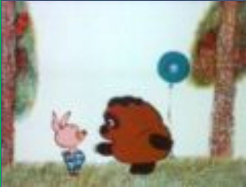
Кадр из мультфильма «Винни-Пух»