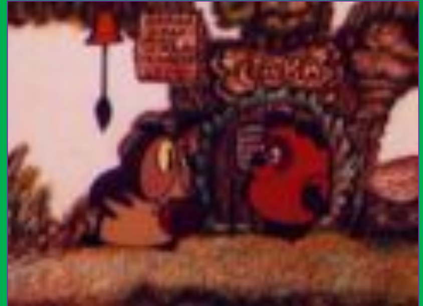
Кадр из мультфильма «Винни-Пух и день забот»