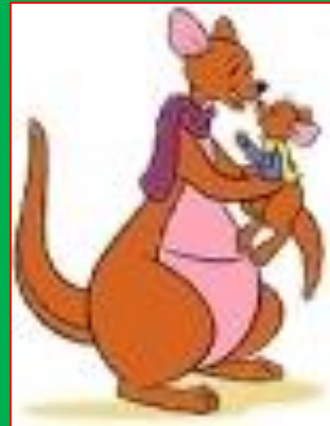
Мама Кенга и Крошка Ру