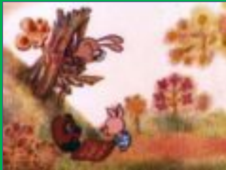
Кадр из мультфильма «Винни-Пух идёт в гости»