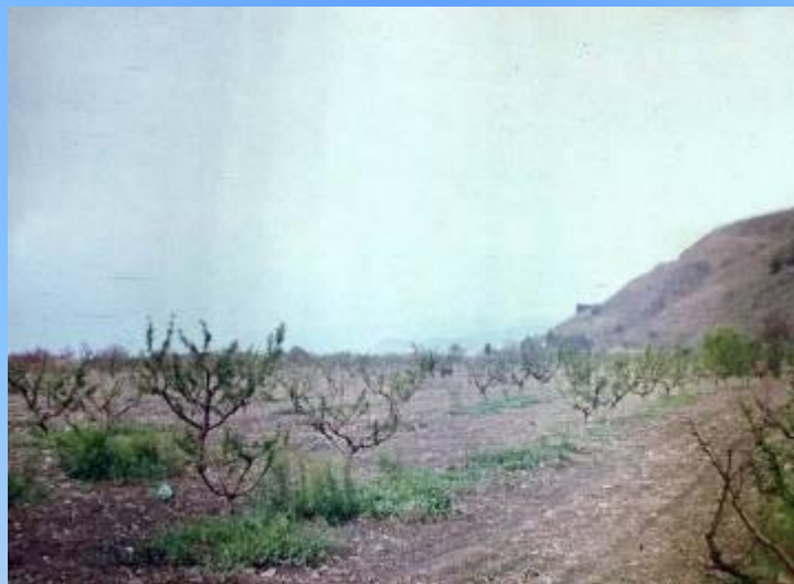
Устье реки Вороны