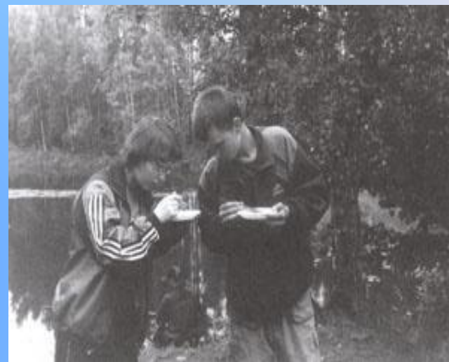
Исток реки Вороны