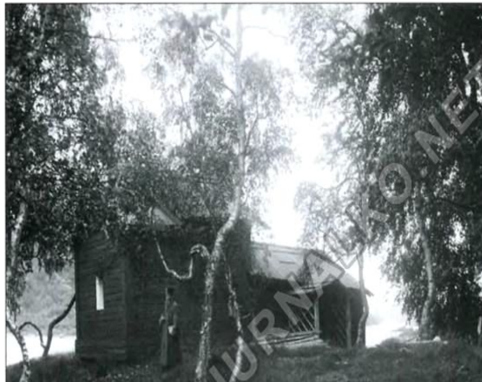
Часовня преподобного Антония Сийского на Емце.

В 1696 году крестьяне Шелековского прихода в память о святом поставили на месте церкви Антония часовню во имя Преподобного Антония Сийского.